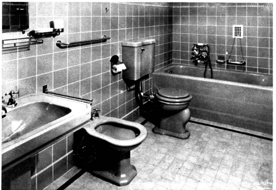
La qualité des appareils est la marque de cette salle de bain. (Document Gétaz-Romang.) (Photo de Jongh.)