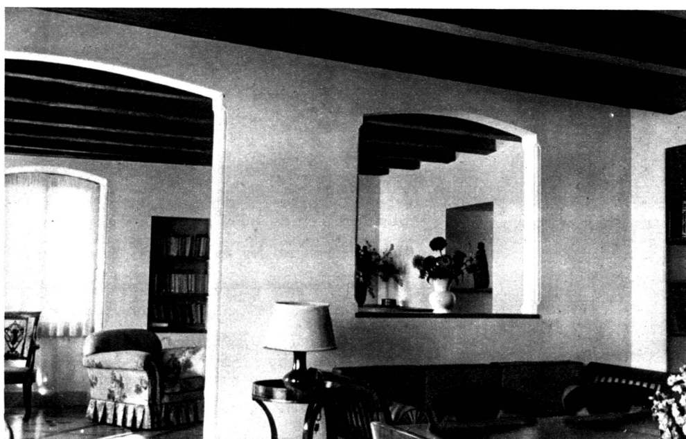
Intérieur à Riex. J.-P. Vouga, architecte.