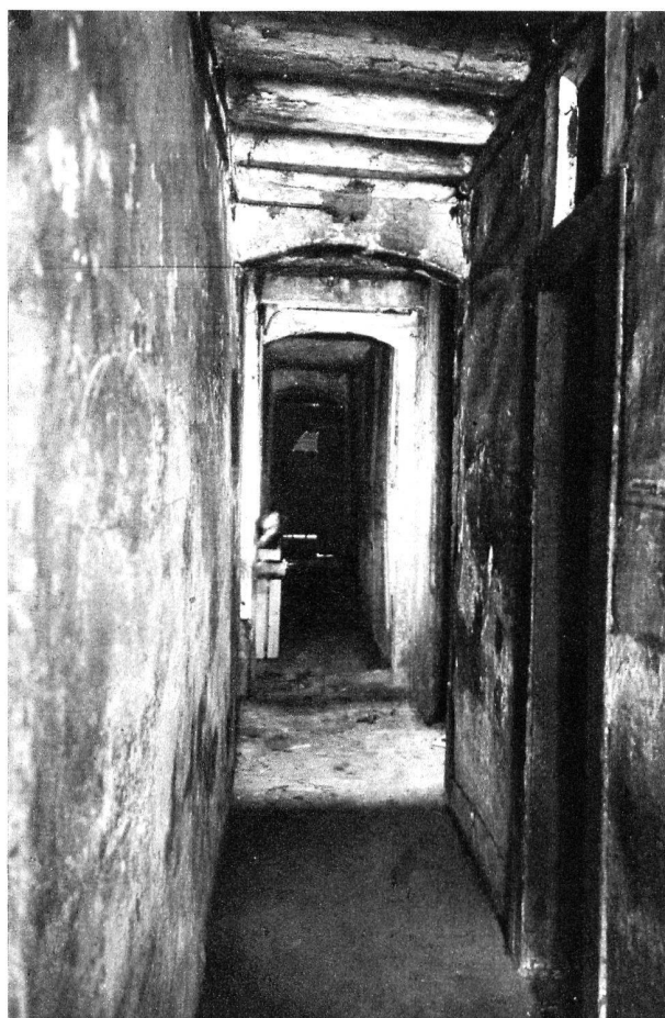
Rue de la Fontaine.