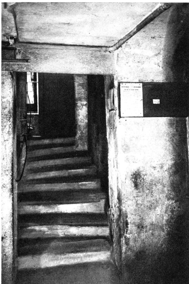
Rue de la Fontaine.