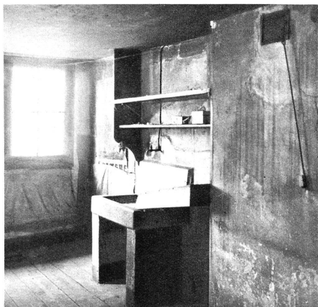
Rue des Chaudronniers.