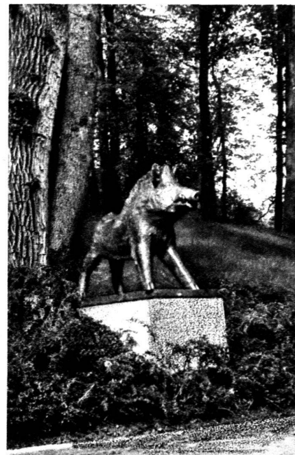
Le sanglier du Denantou (bronze).

Actuellement, Pierre Blanc travaille depuis près d'un an, et pour un an encore, à un poulain que la ville de Lausanne se propose de placer au parc de Valency. L'atelier de Mon-Repos est encombré d'esquisses de poulains en terre ou en plâtre de toutes dimensions, témoins de l'acharnement de l'artiste à dépouiller son œuvre de tout artifice. Pour avoir fait longtemps des bêtes, Pierre Blanc est aujourd'hui paré de l'étiquette d'animalier. Ce silence ainsi créé sur une partie importante de son œuvre n'est pas pour lui plaire bien qu'il en soit un peu fautif. Ses bustes sont parmi ses meilleures choses. Traités toujours avec cette aisance calme qui est la manière du sculpteur, scrupuleusement vrais, ce qui n'est pas leur moindre qualité, on les sent animés de tout ce que la personnalité de l'artiste a su ajouter à l'aspect humain de ses modèles.