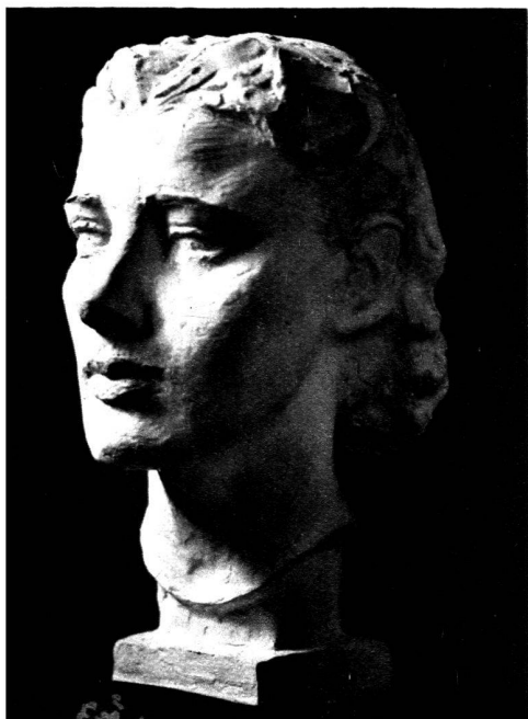
Buste de M me V. (plâtre).