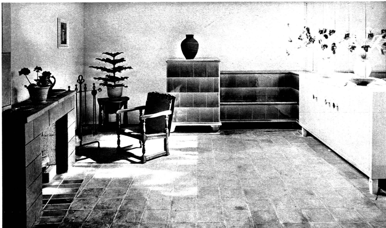
Cheminée et fourneau de catelle.