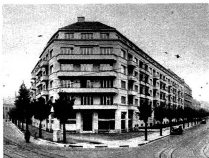
Immeuble de rapport à Zurich, équipé avec la robinetterie antibruit Elysium.

ou d'une chasse d'eau venant se greffer tout à coup sur une conversation ou perturber quelque audition radiophonique.