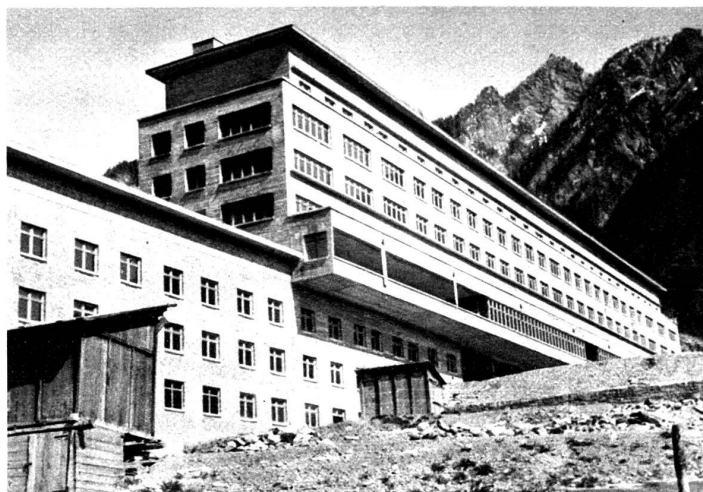
Hôpital cantonal à Coire, actuellement en construction, équipé avec la robinetterie antibruit Elysium

Tout ce qui contribue à solutionner le problème de « l'insonorisation » doit intéresser, à des titres divers : architectes, entrepreneurs, régisseurs et propriétaires.