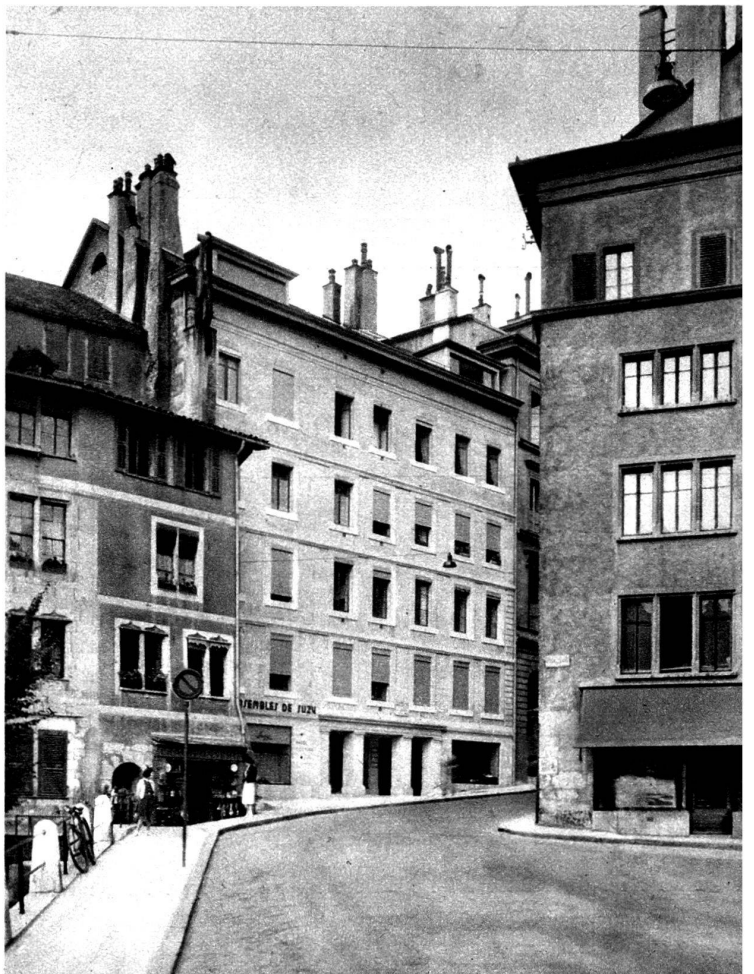
Immeuble, rue de l'Hôtel-de-Ville, 16. En haut : avant la restauration. En bas : après la restauration. Hornung et van Berchem, architectes, à Genève