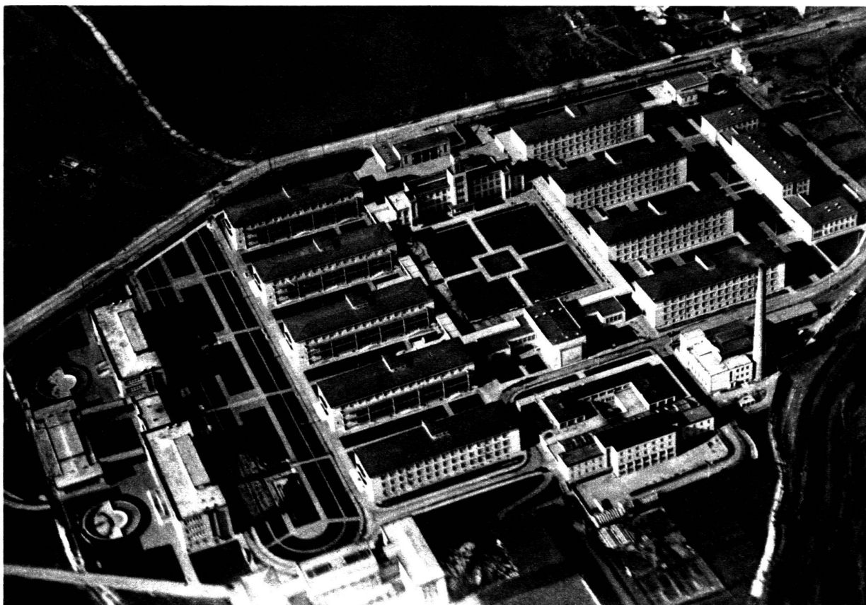
Vue d'avion des Foyers Masaryk.