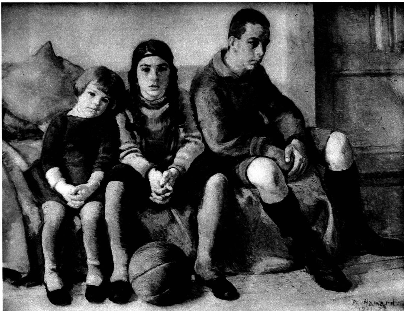
Les enfants de l'artiste.