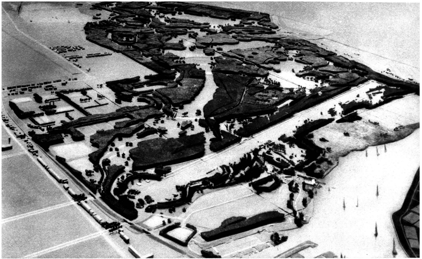
Vue générale, en maquette, du « Bois » projeté à Amsterdam.