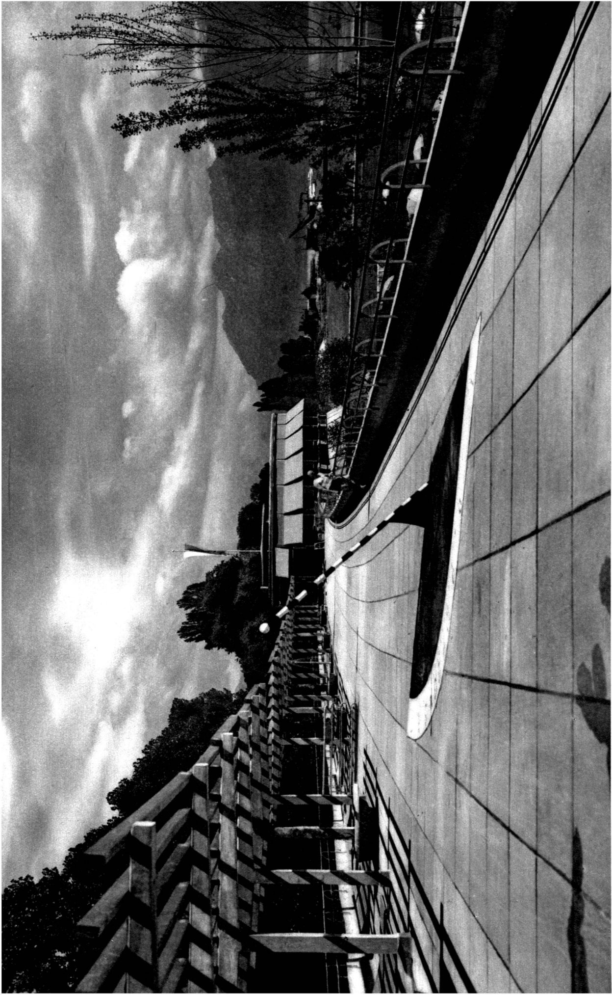
Le solarium et la pergola sur la terrasse supérieure.