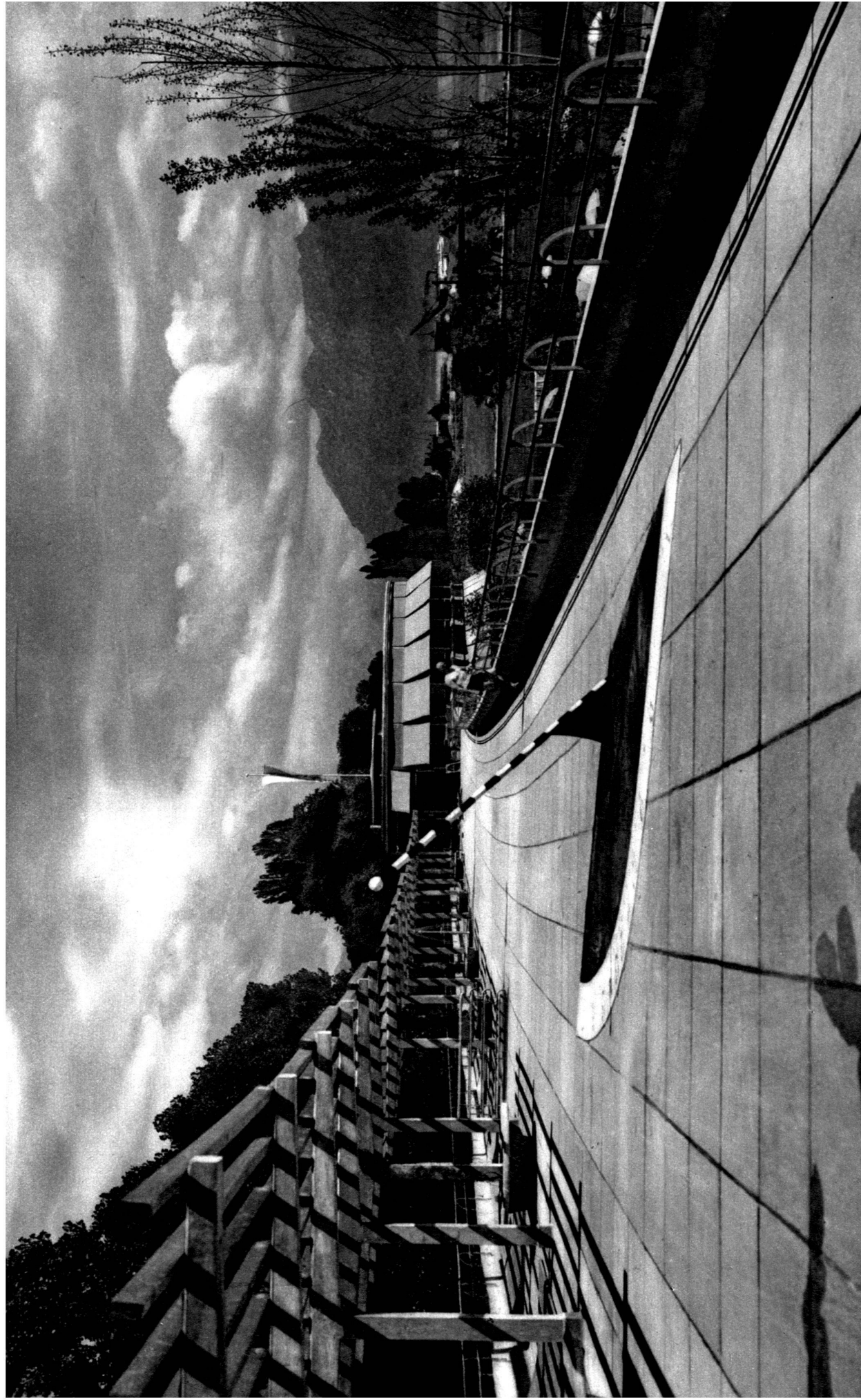
Le solarium et la pergola sur la terrasse supérieure.

La plupart des photos ont été tirées sur film Kodak Panatom