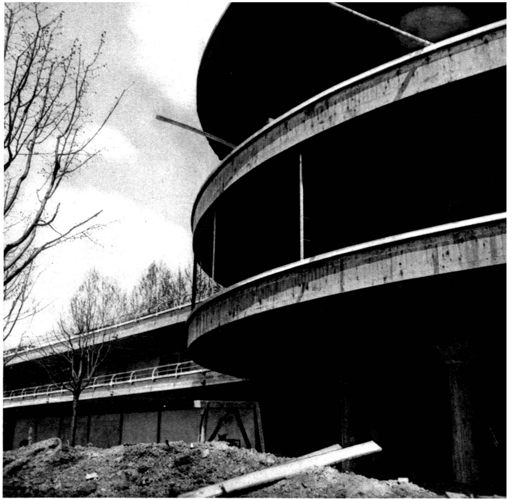
La rotonde après le décoffrage extérieur.