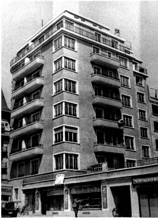
Immeuble rue des Charmilles, 4, Genève

Architecture et direction des travaux : Albert Nobile Maçonnerie et béton armé : J. Rubin S. A.