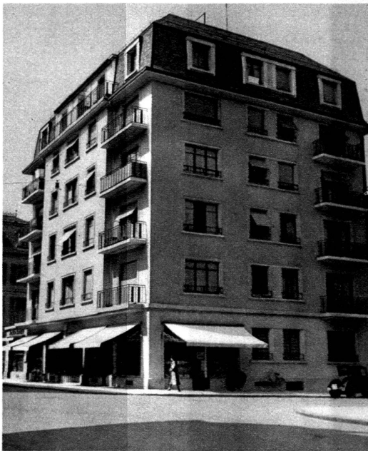
Immeuble rue du Mont-de-Sion, 3, Genève

Cet immeuble de 31 appartements et 3 arcades fait partie d'un ensemble groupé autour d'un square ouvert. Il a été terminé en 1937