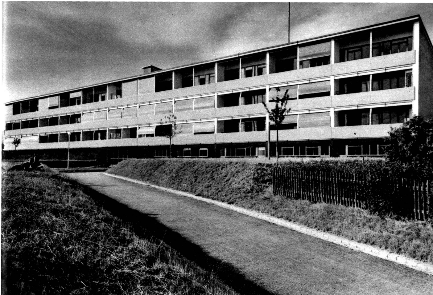
Maison collective à Neuweg-Bâle.

Façade côté balcon (voir face galeries d'accès sur page de couverture).