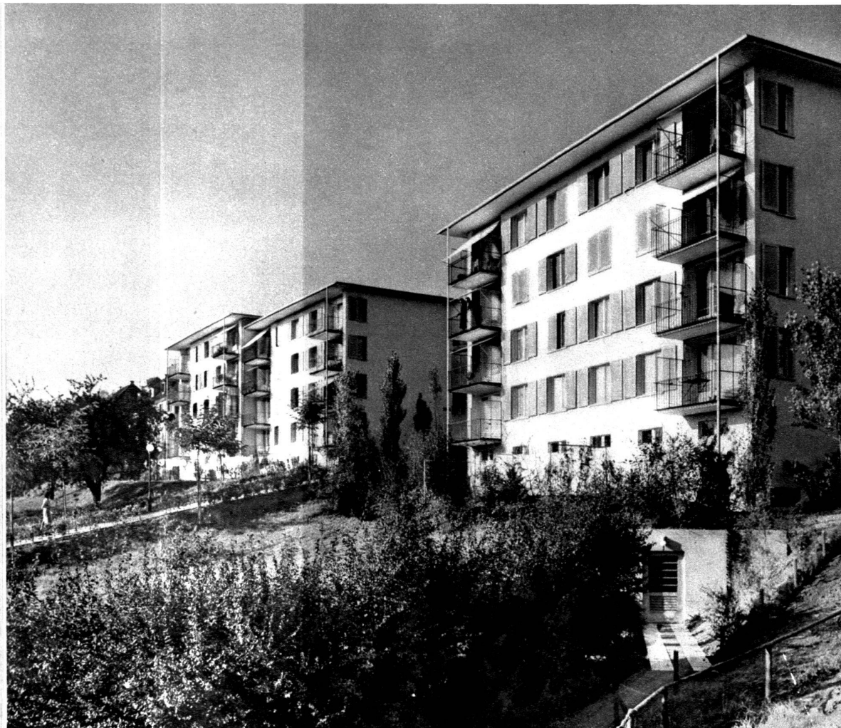
Groupe supérieur sur la Nordstrasse.