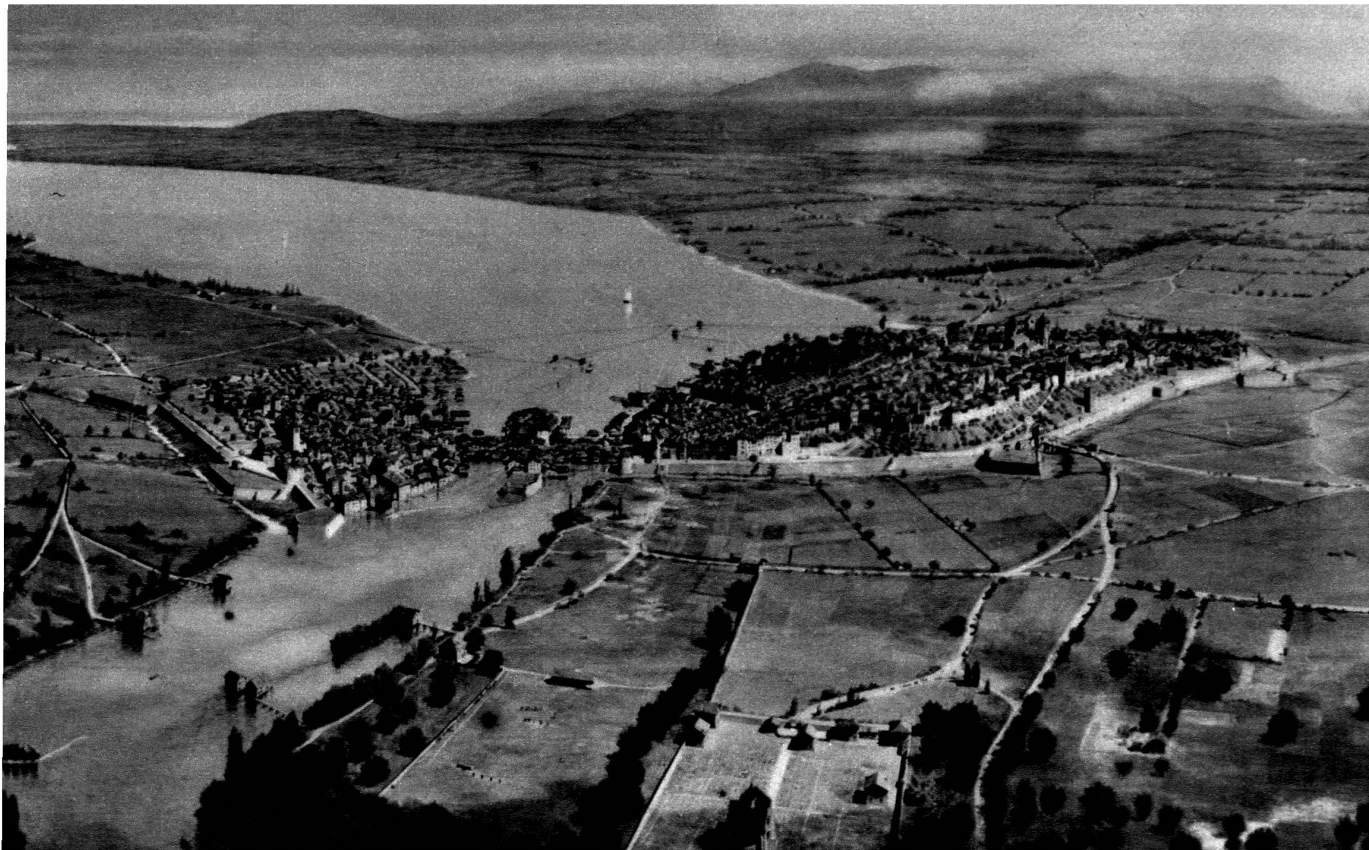
Genève en 1600, d'après une perspective établie par Ziegler. Type de la ville surpeuplée à la fin du moyen âge