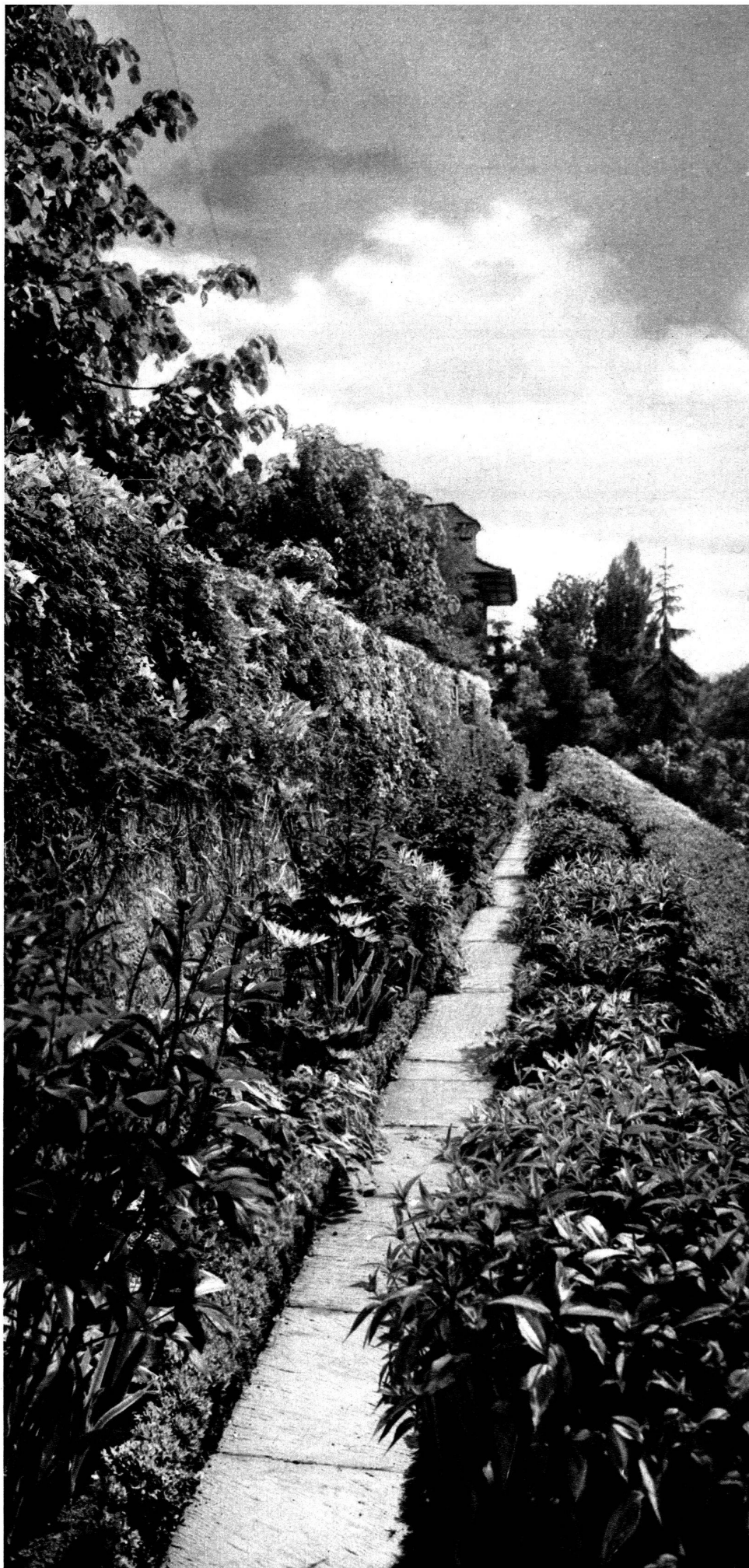
Mertens, architectes paysagistes, Zurich