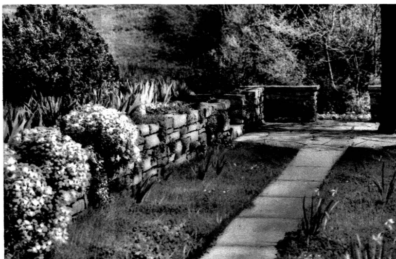
Création de F. Klauser, architecte paysagiste, Rorschach