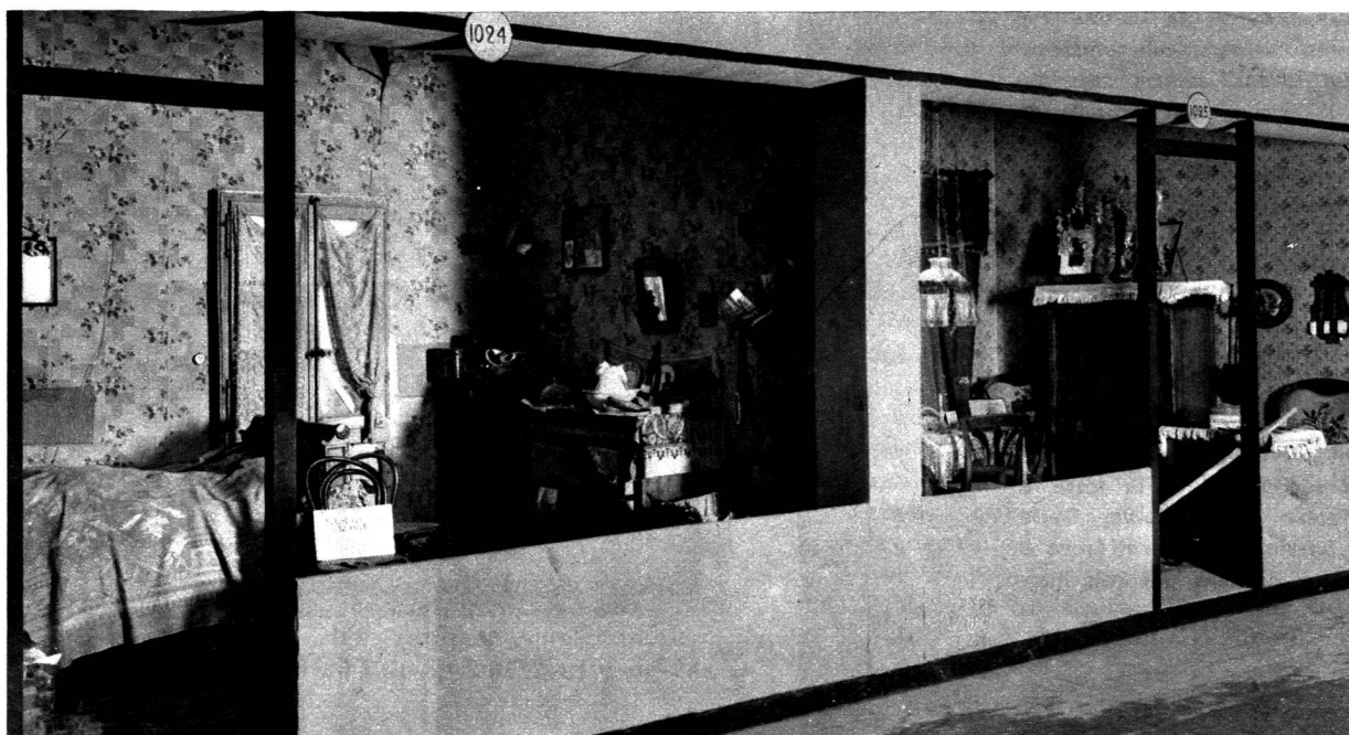
Le taudis. La chambre surannée

Les beaux meubles Louis-Philippe que nous voyons dans l'ensemble de la figure 2 permettront toujours à leur propriétaire d'arranger une chambre dans le sens traditionnel ou moderne du mot. Qu'il s'agisse d'un appartement à la vieille mode ou d'une chambre à grande baie, des meubles de cette catégorie