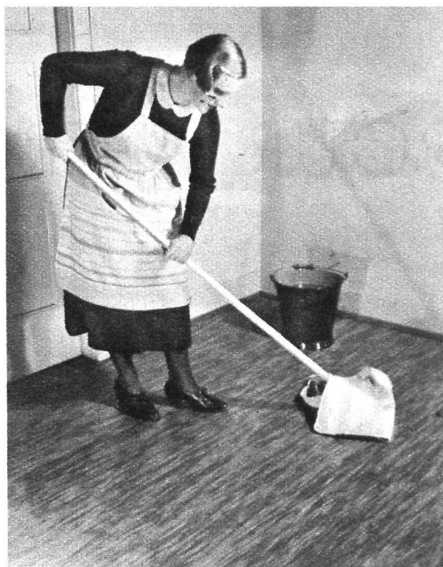
Le premier nettoyage au balai • Ne pas laver ainsi, il y a trop d'eau • Un simple torchon humide suffit