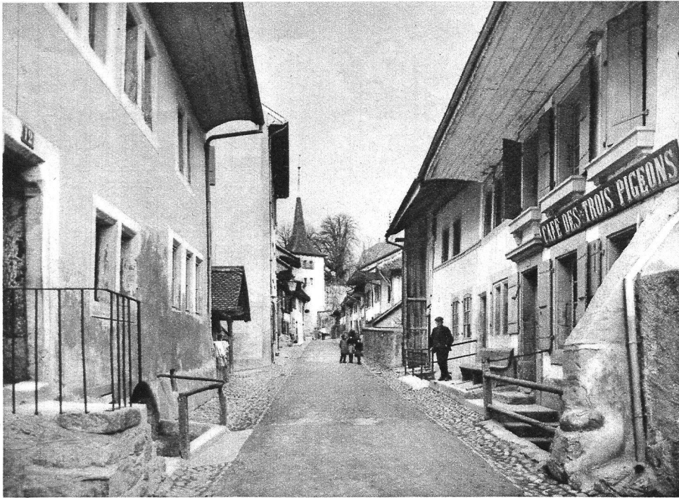
Au XVI e siècle : Le vieux Bourg à Moudon.