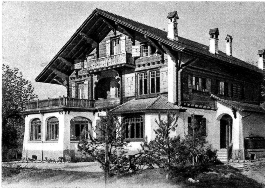
2. Un chalet pastiche dépaycé.