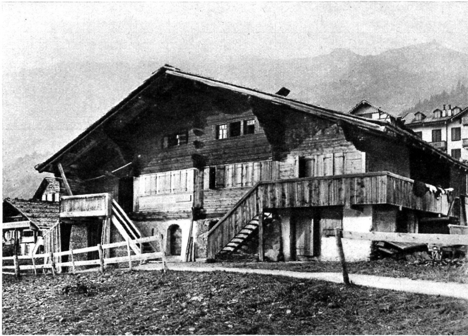
1. Un beau chalet de l'Oberland.