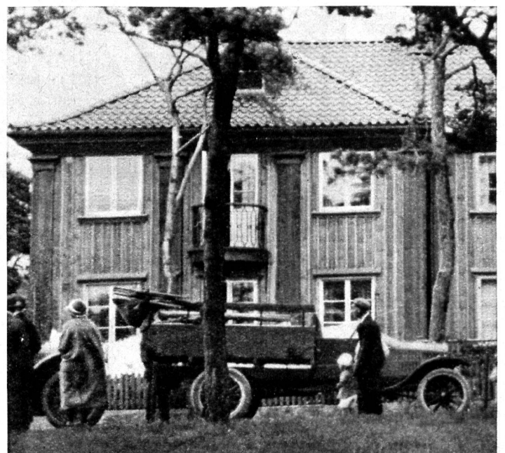
4. Maison de bois avec pilastres.

L'article paru dans le fascicule de décembre 1934 nous a valu quelques remarques qui nous obligent à revenir sur cette question. Précisons que c'est au nom de la tradition que nous combattons l'introduction du chalet dans nos villes et c'est pour le bon aspect de nos quartiers urbains que nous demandons une forme nouvelle de la maison de bois dans nos villes de la Suisse romande.