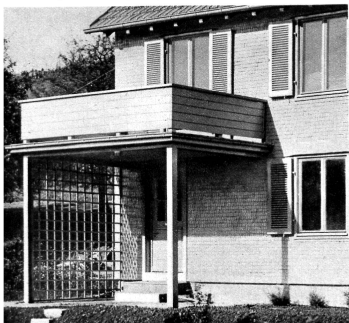
5. Maison couverte de bardeaux, à Winterthour.