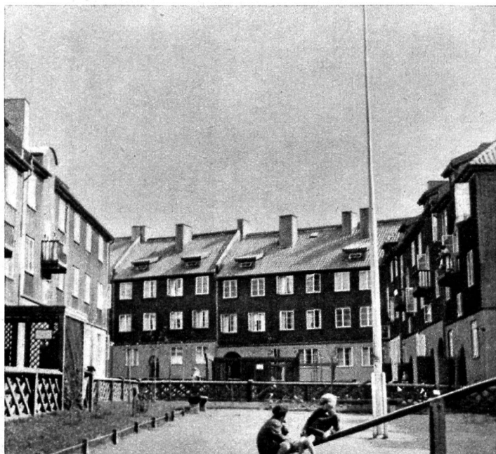
3. Maisons urbaines en Suède.