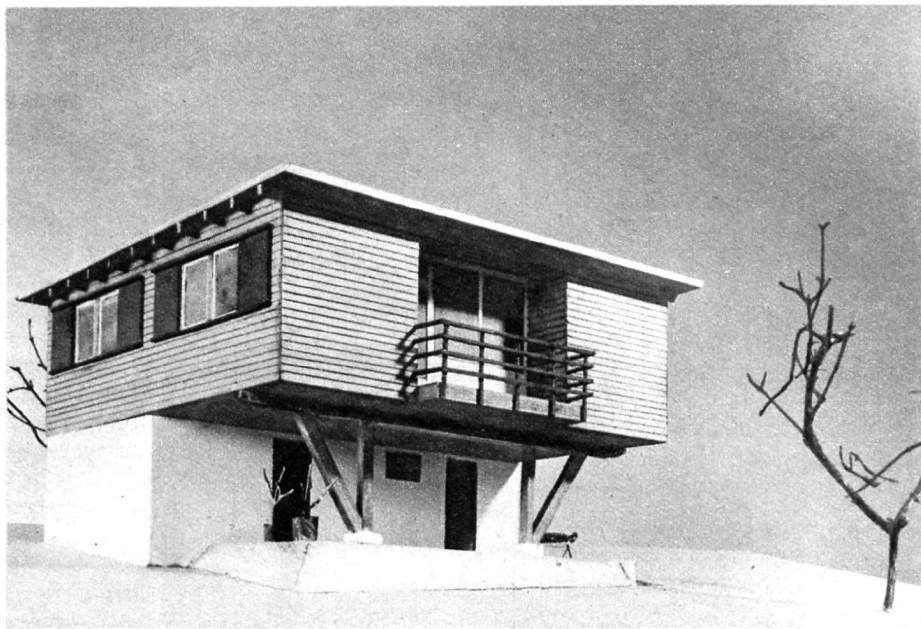
8. Maisonnette de campagne (maquette de concours)

Les deux dernières illustrations nous montrent des projets de maisons modestes en bois, conçues avec une architecture moderne. Ce sont des maquettes primées lors du concours institué l'année passée par la «Lignum» (Association des professionnels du bois) et le «Werkbund» (Association d'industriels et d'artistes) en vue de provoquer un renouveau dans la construction en bois. Ce dernier matériau, produit naturel de notre pays, est d'un prix actuellement très bas, ce qui rend ce genre d'habitations très intéressant au point de vue économique dans certaines régions. Hl.