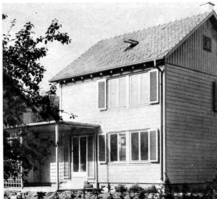
6. Maisons revêtues de lames horizontales, à Winterthour.