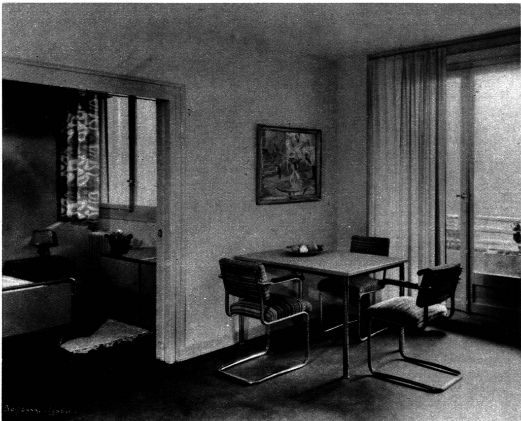
Table lino gris. Etoffes tissées main. Rideaux lamelle de soie beige. Bois laqué vert pâle.

au fond, la chambre à coucher séparée par une porte à coulisse.