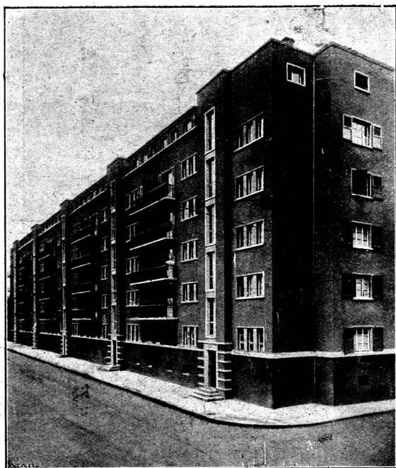
Vue de l'angle rue Simon-Durand et rue des Allobroges.

Clichés et texte de la Revue « BATIR » organe de l'A.D.E.A