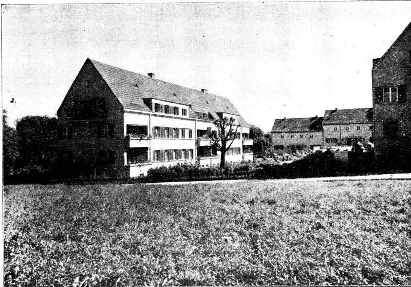
Cité-jardin de Entlisberg.

1 re étape de construction de maisons collectives de Hintermeisterhof.