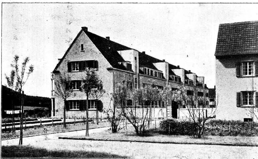
Hintermeisterhof 1 re étape de construction de maisons collectives.

Comme ceux des deux premières étapes, les logements de la troisième sont soigneusement installés, avec l'eau chaude, des fourneaux et des lessiveuses électriques. Le sol des chambres et des corridors est revêtu de linoléum, la couleur des vernis est bien étudiée et les tapisseries choisies avec goût.