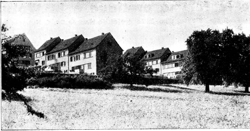
Cité-jardin de Entlisberg.

2 e étape de construction de maisons familiales.