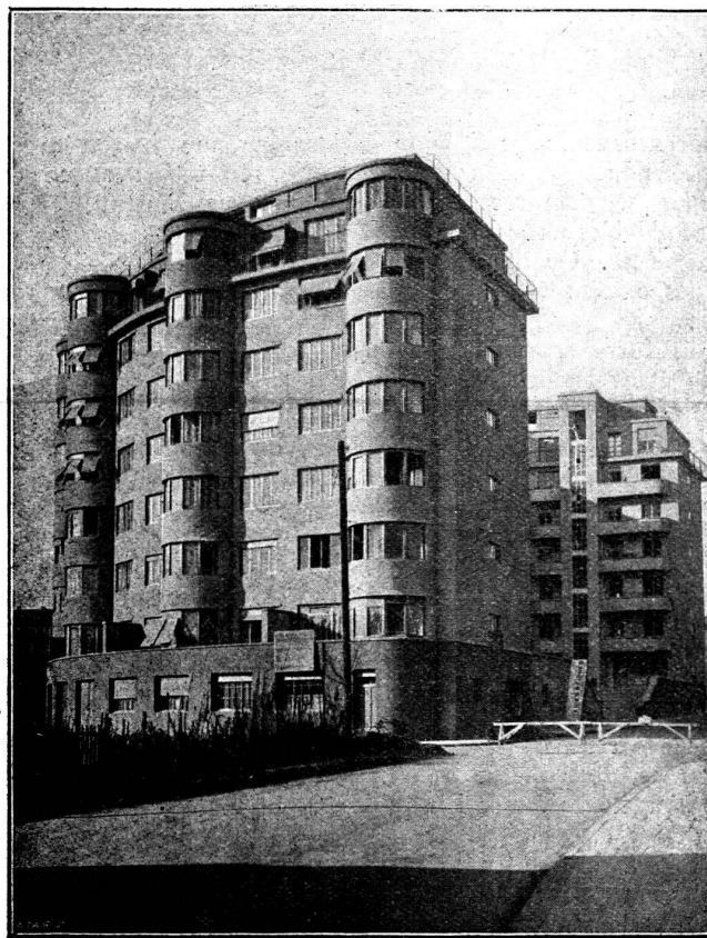
Fig. 1. Vue d'ensemble.

Il est toujours assez gênant d'avoir à décrire une œuvre que l'on a construite soi-même, aussi le lecteur voudra-t-il s'armer de patience et ne pas s'étonner si les immeubles que nous allons examiner, sont vus uniquement par un œil descriptif.