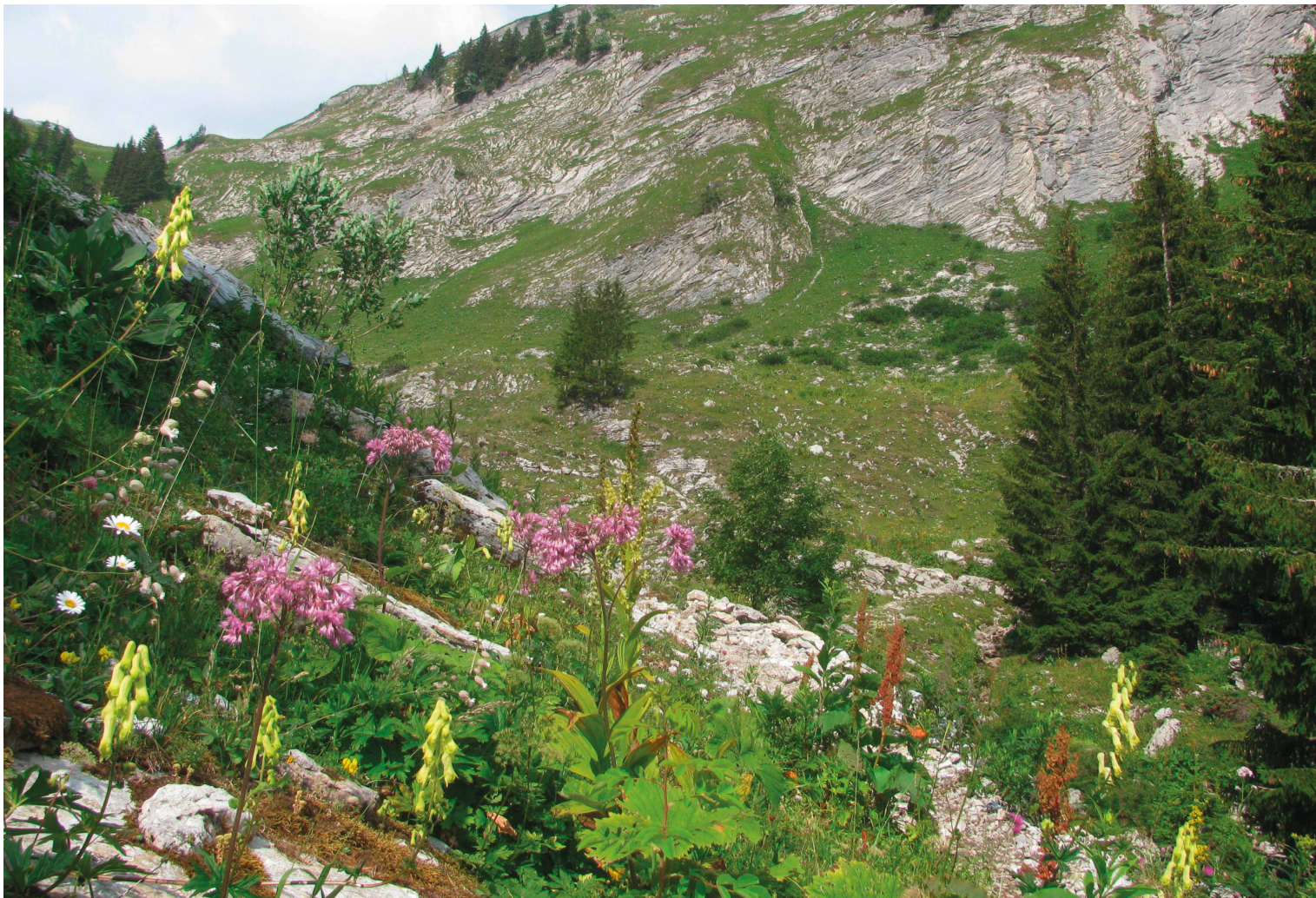
Les Morteys, un vallon sauvage à la flore préservée.

Flore d'altitude des Préalpes fribourgeoises et estivage