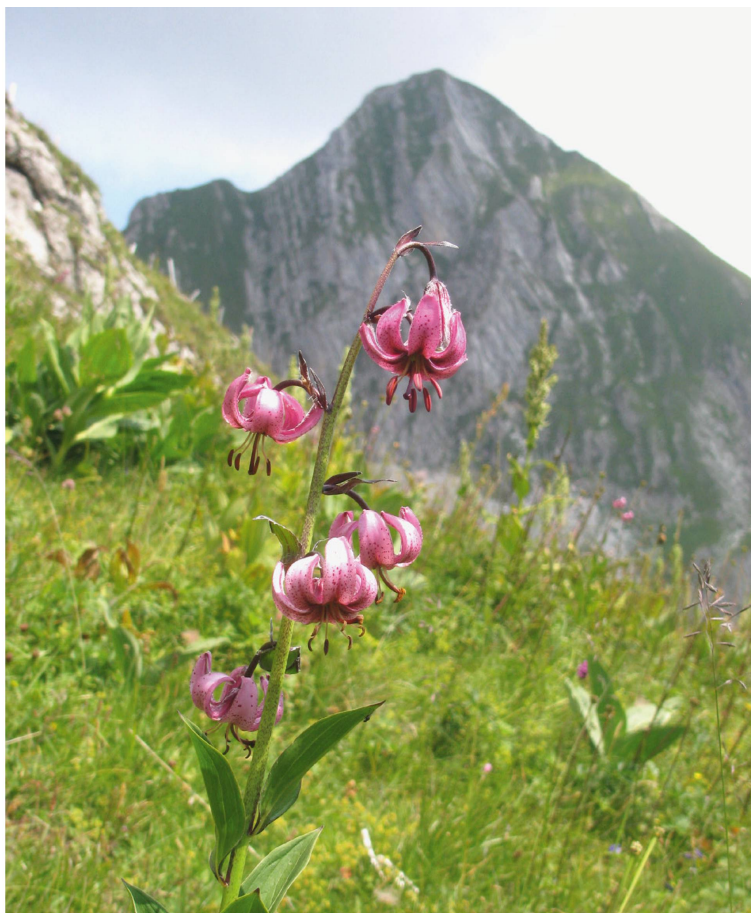
Belle surprise : un superbe lys martagon pas très loin de la cabane des Marindes, avec Folliéran en arrière-plan.

L'arrivée du dérèglement climatique dans cette équation déjà compliquée pose des questions intéressantes : vaut-il la peine de préserver une végétation qui de toute manière est amenée à disparaître avec les changements en cours ? Il ne s'agit pas de protéger seulement des plantes, mais bien des milieux naturels dans leur ensemble. Il est très probable que certaines espèces vont disparaître à plus ou moins court terme. Mais les milieux comme les crêtes, les combes à neiges ou les éboulis resteront les endroits les plus froids du canton et pourront continuer à jouer leur rôle de refuge dans le futur. À nous d'en prendre soin maintenant 3 .