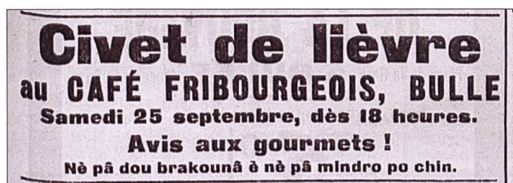
(fig. 2) Ce n'est pas du braconné et il n'est pas moins bon pour autant. La Gruyère, 24 septembre 1926

Les quarante-cinq réclames en patois et/ou bilingues de notre corpus attirent l'attention des chalands sur des produits de consommation courante (vêtements, chaussures, corsets, livres en patois, etc.) Elles servent aussi parfois à faire la promotion d'un événement festif, populaire et traditionnel (Saint-Denis, Bénichon, Recrotzon). Parfois, elles incitent à se déplacer pour une spécialité culinaire comme la fondue ou la chasse; plus tardivement, pour un spectacle ou un théâtre en patois (fig. 2 et 3):