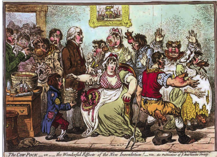
The Cow-Pock. Dessin moquant la vaccination contre la variole, publié en 1802 en Angleterre. Source: James Gillray [Public domain], via Wikimedia Commons.

de la santé, la population se rebelle. L'incompréhension et le manque de sens ouvrent la voie à la résistance, seule alternative pour la population de reprendre le contrôle. Le faible niveau d'éducation et le manque d'information se font complices du développement de rumeurs : ainsi naît le scepticisme face à la vaccination.