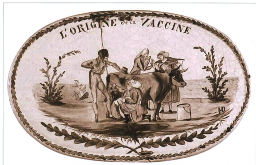
L'origine de la vaccine. Caricature parue au XX e siècle

Fin du XVIII e siècle. Edward Jenner est médecin de campagne à Berkeley (GB). Impuissant, il fait face à de nombreuses épidémies de variole. Cependant, il constate que les vachers, qui traitent des vaches atteintes de vaccine (variante bovine de la variole qui se présente sous forme de pustules sur les pis), semblent moins enclins à développer la