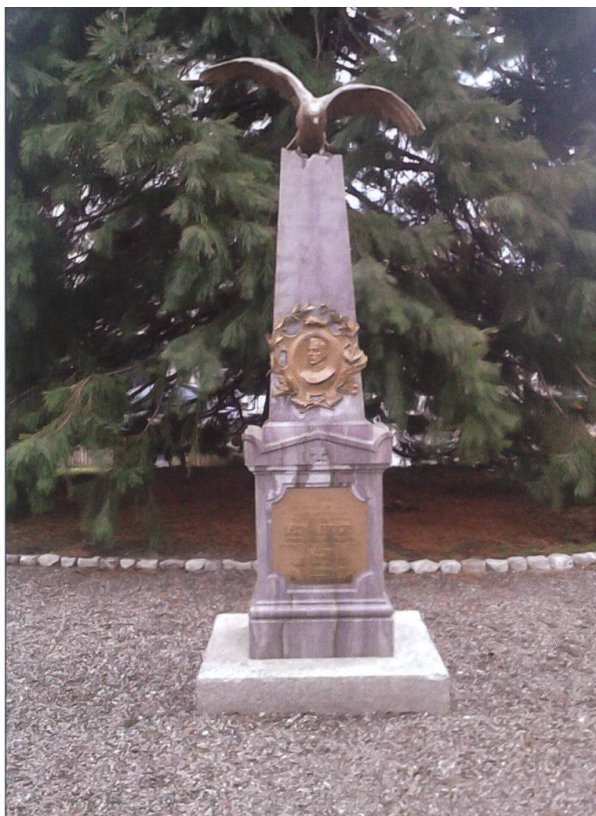
Monuments dédiés à Léon Progin, inaugurés en 1921 (gauche) et 1929 (droite). Le monument de 1921 se trouve aujourd'hui au cimetière de la ville de Bulle, celui de 1929 se situe au Jardin anglais.