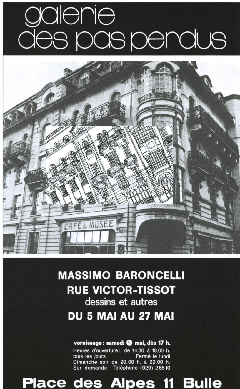
Affiche de l'exposition Rue Victor-Tissot à la galerie des Pas Perdus, Bulle. Collection privée.