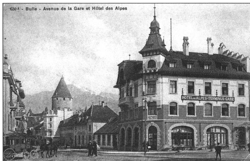
L'Hôtel des Alpes, à Bulle, fut considéré comme le «Moderne numéro deux».

Avec ses encadrements et son socle en pierre de taille, ses façades sobrement crépies, sa tour d'angle, sa toiture de tuiles plates, ses avant-toit et son petit berceau lambrissé, l'Hôtel des Alpes s'inscrivait mieux dans l'image pittoresque de Bulle. Sorte de Viollet-Le-Duc local, sollicité dans tout le canton au chevet des remparts, des châteaux et de églises, Frédéric Broillet fut également le promoteur de style nationale puisant aux sources de l'architecture vernaculaire. Le Convict Salesianum (1906-1907), cette pension pour étudiants en théologie qu'il a plantée au sommet de la colline de Gambach à Fribourg, a été unanimement saluée comme une réussite. Sa silhouette est pourtant aussi massive que les hôtels dont on dénonçait l'emprise sur le paysage. Affaire de goût sans doute: le Heimatstil fait désormais de l'ombre à un éclectisme trop cosmopolite et urbain. Le Grand Hôtel ne cadrerait pas avec l'image idyllique de la Gruyère. On l'a trouvé dissonant jusque dans sa version la plus modeste, comme l'Hôtel Bellevue à Broc (1903). La leçon aura au moins servi. L'Hôtel Cailler à Charmey ne s'est-il pas déguisé en chalet pour assurer son succès?