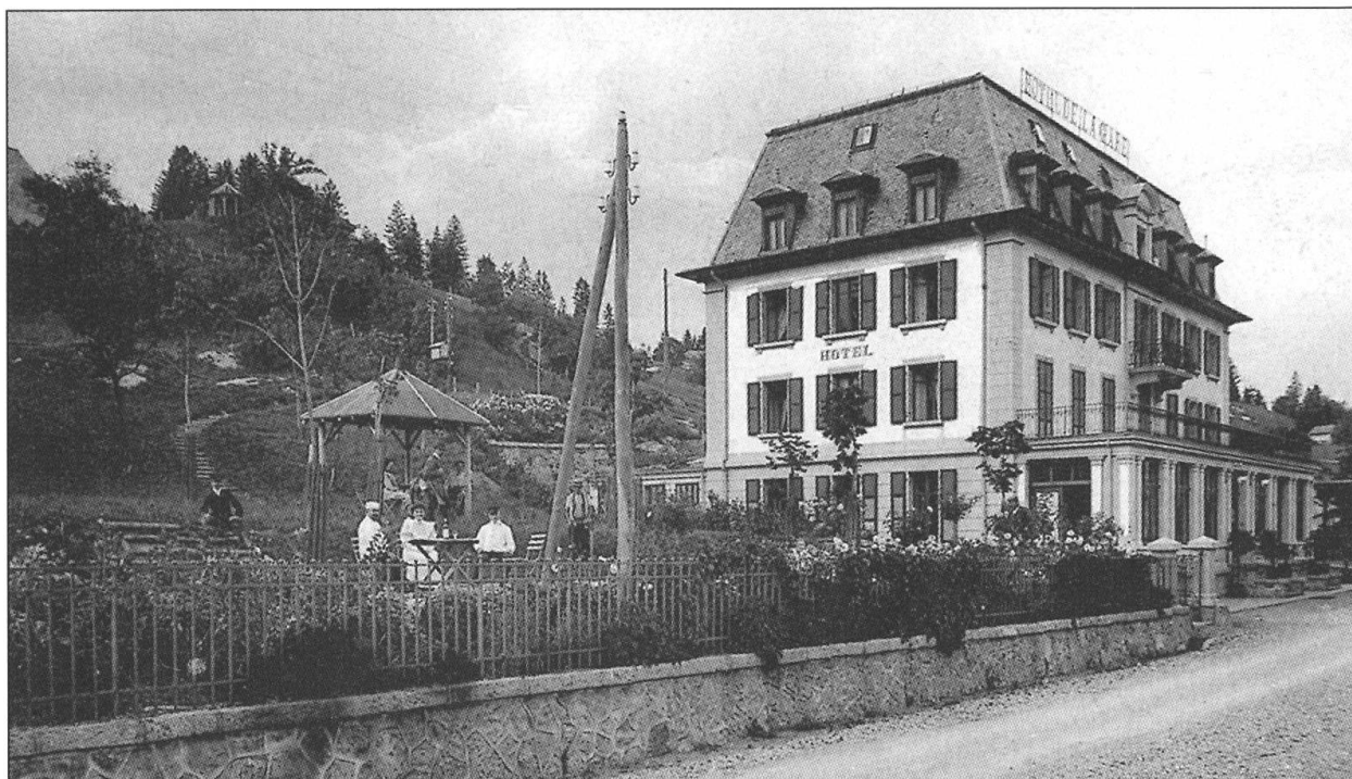
L'Hôtel de la Gare à Montbovon (1905), un Hôtel Garni entre l'Hôtel-Pension et le Grand Hôtel.

Collections du Service des Biens culturels, Fribourg