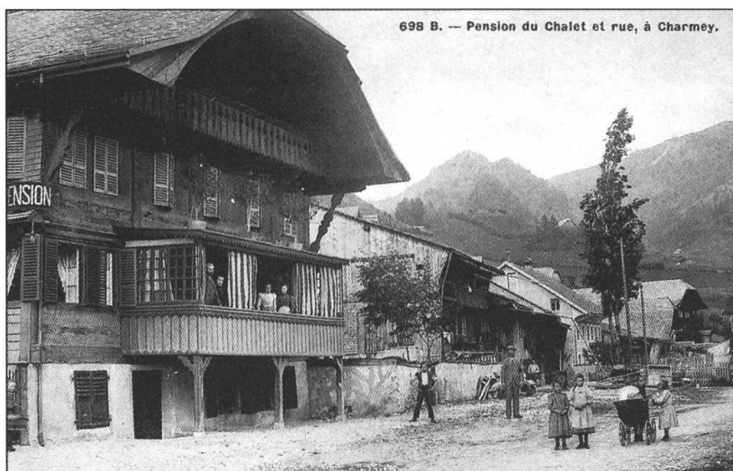
La Pension du Chalet à Charmey, le grand écart entre luxe et pittoresque.