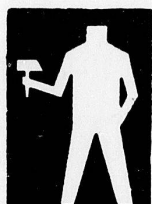
Konfessionelle und gelbe Verbände

Die zweite Darstellung bezieht sich auf die Mitglieder der V. S. A. ( 2\frac{1}{2} ) und auf den Förderativverband ( \frac{1}{2} ).