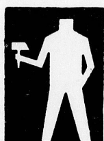
Konfessionelle und gelbe Verbände

Die zweite Darstellung bezieht sich auf die Mitglieder der V. S. A. ( 2\frac{1}{2} ) und auf den Föderativverband ( \frac{1}{2} ).