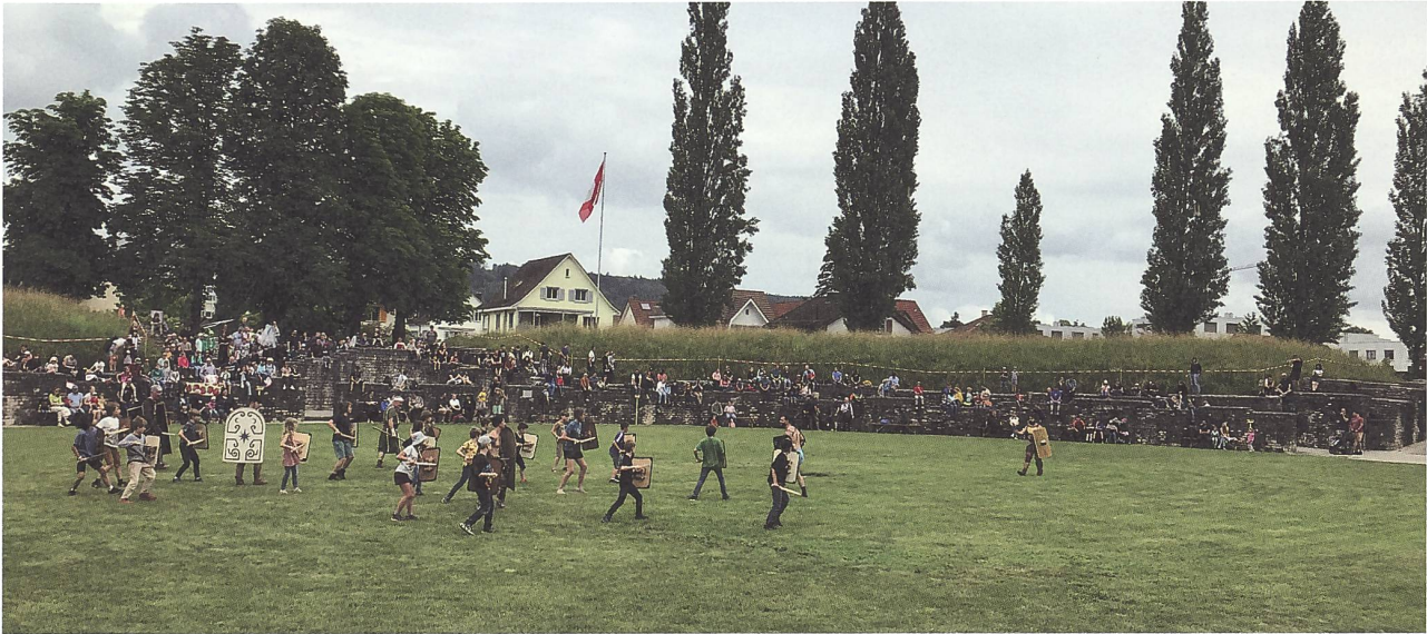
Abb. 1: Römertag Vindonissa 2024. Die Gladiatoren der Gruppe Amor Mortis bilden die Kinder zu Gladiatoren aus.

mit der Schweizer Stiftung für Sozialtourismus (Youth Hostel) Miteigentümerin eines Teils des «Schlössli Altenburg». Und vom Bund sind wir als Verwaltung des Amphitheaters eingesetzt. Der Vorstand kam zum Schluss, dass die Immobilien eine Belastung für den Verein darstellen. Der Schutz und die Erhaltung der Ruinen sind heute gesetzlich geregelt und bedürfen unserer schützenden Hand nicht mehr. Es ist die Absicht des Vorstandes für die Immobilien zumindest teilweise neue tragfähige Lösungen zu finden. Die Ausgangslage aller Immobilien der Gesellschaft wurde inzwischen geklärt, und Strategien für den zukünftigen Umgang mit den Objekten wurden erarbeitet.