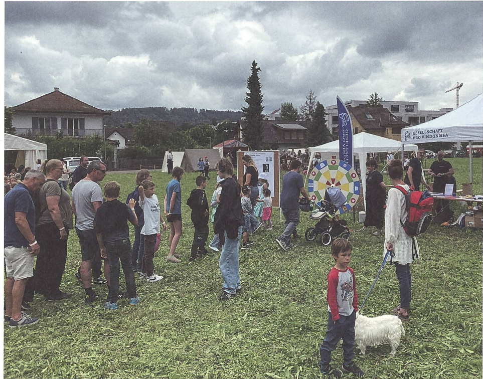
Abb. 3: Römertag Vindonissa 2024. Das Glücksrad am Stand der Gesellschaft Pro Vindonissa entpuppte sich als Publikumsmagnet.

Ein beliebter Schwerpunkt sind jeweils die Workshops der Kantonsarchäologie Aargau, wie Buchzeichen, Ehrenabzeichen oder Helm basteln. Die Gesellschaft Pro Vindonissa lockte mit einem Glücksrad zahlreiche Interessierte an ihren Stand (Abb. 3).