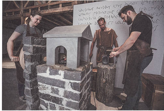
Abb. 11: Schmieden in der fabrica des Legionärspfad Vindonissa.

Vindonissa und dem Freiwilligenprogramm Museum Aargau 15 .