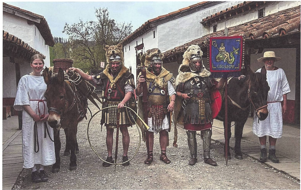
Abb. 4: Standartenträger und Cornicen der Legio XI Claudia Pia Fidelis zwischen zwei Maultieren mit Treiberin und Treiber am Eröffnungsfest im Legionärspfad Vindonissa.