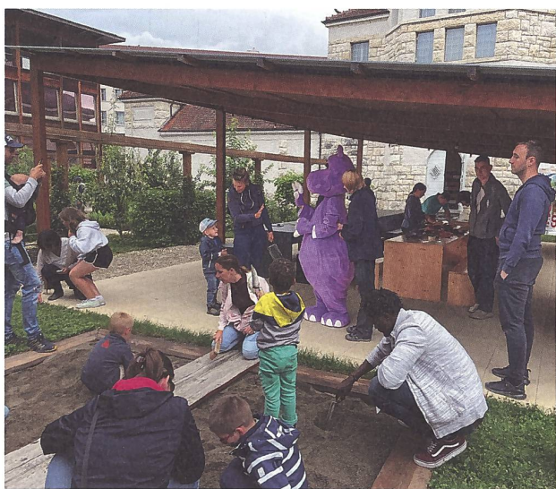
Abb. 6: Familiensonntag mit Coop mit «Pippa» im römischen Garten des Vindonissa Museum.

Dank einem finanziellen Engagement von Coop profitierten an vier Sonntagen im Juli 8 alle Besucherinnen und Besucher im Legionärspfad Vindonissa