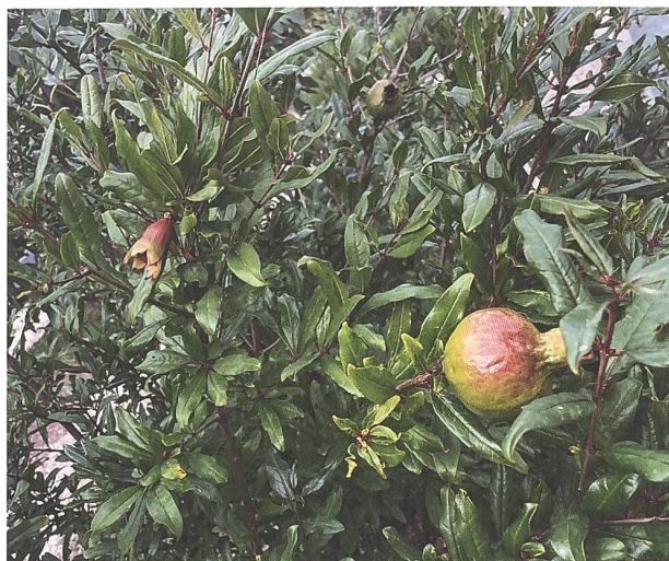
Abb. 2: Heranreifende Granatäpfel im römischen Garten des Vindonissa Museum.

Dem Thema «Bauen und Bauten» bei Römern und Habsburgern widmete sich das von der Stiftung Vindonissapark ausgerichtete Vindonissapark-Fest 2 . Die Museum-Aargau Standorte Vindonissa Museum, Legionärspfad Vindonissa und Schloss Habsburg boten vielfältige Aktivangebote und Führungen an. Im Vindonissa Museum erwarteten die Besucherinnen und Besucher eine Führung zur römischen Baukunst sowie Workshops zur Herstellung von Steinmosaiken. Die Gesellschaft Pro Vindonissa ermöglichte den Gästen eine exklusive Führung zur Architektur des Vindonissa Museum – eines Gesamtkunstwerks des Jugendstils. Im römischen Garten, unmittelbar neben den dort angepflanzten Weinreben, vermittelten die Vindonissa-Winzer beim Traubenstampfen und Römer-Wy-Degustieren die römische Weinbaukultur mit allen Sinnen. Die vom Stadtmuseum Brugg durchgeführten Führungen zum schwarzen Turm öffneten den Horizont Richtung Brugger Altstadt und zeigten die dortigen Bezüge zum Legionslager Vindonissa auf.