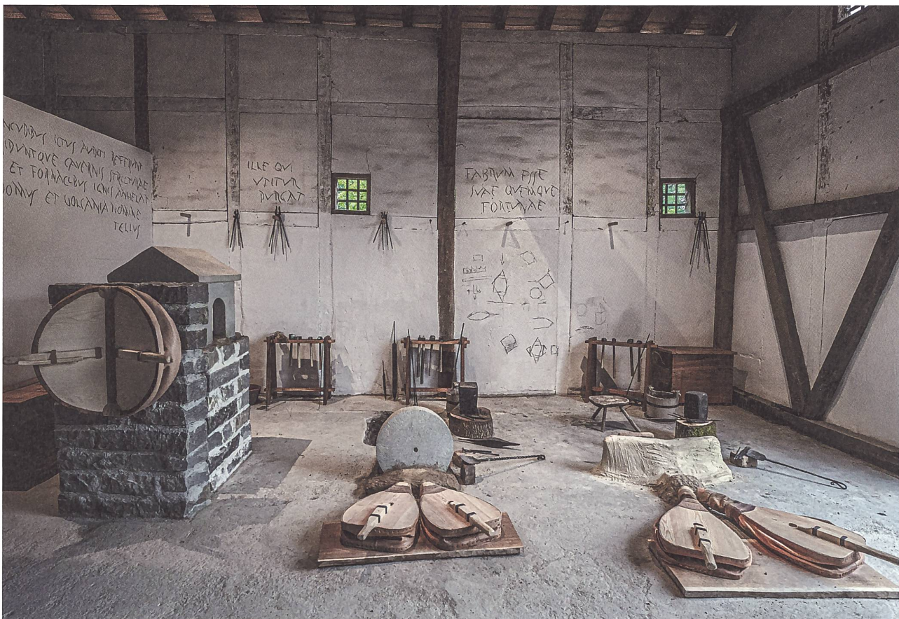
Abb. 9: Die rekonstruierten römischen Schmiedearbeitsplätze in der fabrica des Legionärspfad Vindonissa.