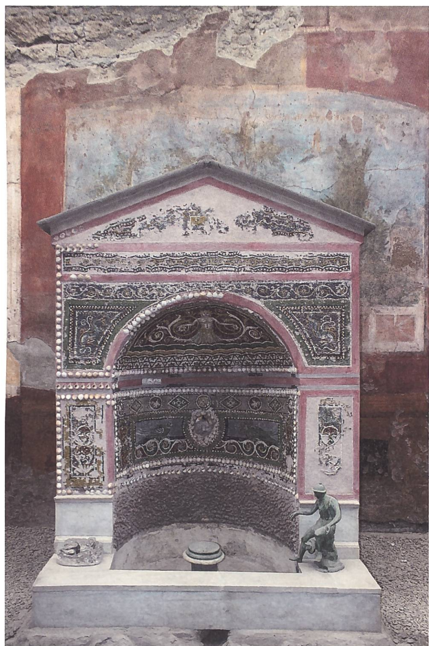
Abb. 4: Reich mit Mosaiken und Muscheleinlagen geschmückter Brunnen im Hof der Casa della Fontana piccola in Pompeij (I).

Am Schluss unserer Forschungsreise kommen wir zurück auf diese beiden Austernschalen, welche G. E. Thüry im Material von Vindonissa entdeckt hat. Eine der beiden wurde nämlich in den Lagerthermen ( thermae legionis ) gefunden 29 (Abb. 1, rechts), und zwar im Caldarium,