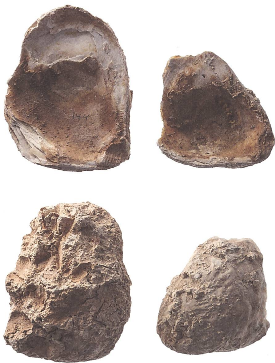
Abb. 1: Austernschalen aus Vindonissa, links (Inv.-Nr. V.03.1/0.15) aus dem Schutthügel, rechts (Inv.-Nr. 30:2442) aus den Lagerthermen. Etwa M. 1:2.

Keywords: Vindonissa, Oberkulm, oyster shells, wall decoration, baths.