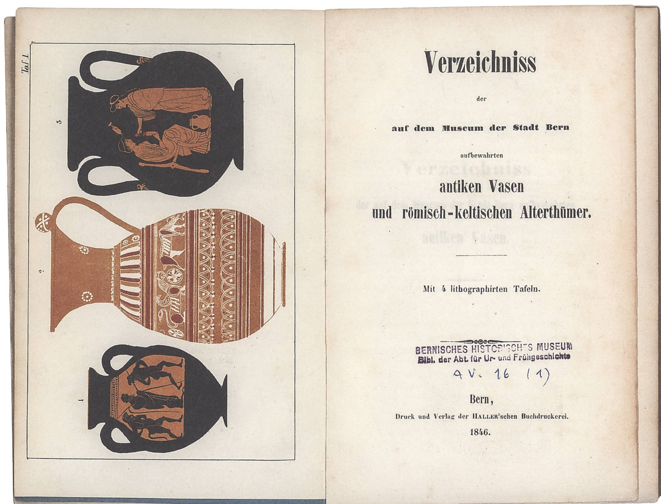
Abb. 1: Titelblatt des «Verzeichniss der auf dem Museum der Stadt Bern aufbewahrten antiken Vasen und römisch-keltischen Alterthümer» von 1846. Darin sind die einheimischen archäologischen Objekte der Museumssammlung aufgeführt – darunter einige aus dem Kanton Aargau.

präsentiert «A. Römische Antiquitäten» mit 217 Einträgen und «B. Keltische Alterthümer» mit 72 Einträgen grösstenteils aus der heutigen Schweiz, wobei keltisch im damaligen Forschungsgeist allgemein für Vorrömisches steht. Teil A wird weiter in «I. Statuetten und Reliefs, meist aus Bronze», «II. Bronzene Tierbilder», «III. Utensilien, Waffen und Schmucksachen aus Bronze, Eisen und Knochen», «IV. Inschriften», «V. Töpfer- und Glaswaren», «VI. Mosaikboden, Würfel, Architekturstücke und Ziegel», «VII. Abbildungen antiquarischer Gegenstände» und «VIII. Vermischtes» gegliedert, Teil B in «I. Waffen», «II. Utensilien» und «III. Menschenknochen». Ausgewählte Objekte werden am Schluss auf zwei Tafeln illustriert (Abb. 2).