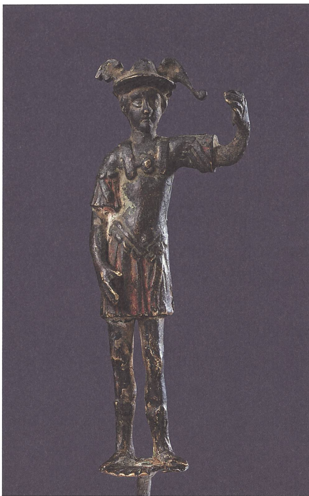
Abb. 5: Die Merkurstatuette (Inv.-Nr. BHM A / 16203; H: 12 cm) – 1794 in Vindonissa gefunden – ist eines der zahlreichen Objekte, die aus der Sammlung E.L. Hallers von Königsfelden an das Berner Museum gelangten.

Im Verlauf seines Lebens trug Franz Ludwig Haller von Königsfelden (1755–1838) eine umfangreiche Sammlung römischer Objekte aus der Schweiz zusammen, die von der Stadt Bern auf Anraten der Bibliothekskommission 1835 angekauft wurde 27 . Eine zusätzliche Anstellung blieb Haller aus Alters- und gesundheitlichen Gründen jedoch verwehrt. Die Kommission würdigte indessen seine archäologischen Verdienste und sprach ihm zusätz-