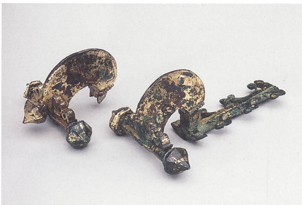
Abb. 3: Links: Massive, vergoldete Zwiebelknopffibrel aus der Sammlung des Bernischen Historischen Museums (Inv.-Nr. BHMA/14318), die gemäss «Verzeichniss» vielleicht aus Kulm AG stammt. Rechts: Ein werkstattgleicher Altfund aus Vindonissa ohne genauere Lokalisierung (Inv.-Nr. KAAG KAA 332.1).

teil war unter Berner Herrschaft – ein römischer Gutshof untersucht. Die vier Zwiebelknopffibeln, darunter eine massive, vergoldete, sind dabei im Kontext eines römischen Gutshofs besonders bemerkenswert. Im Verzeichniss von 1846 werden die Zwiebelknopffibeln noch mit unsicherer Fundortangabe geführt, im Gegensatz zu späteren Museumsverzeichnissen 19 und in Kapitel B als keltische Objekte aufgeführt, obwohl sie in die Spätantike datieren. Auch im damaligen Grabungsbericht sind sie nicht erwähnt. Deshalb ist die Fundortangabe mit einer gewissen Vorsicht zu betrachten. Zumal für das massive Stück ein werkstattgleicher Fund aus Vindonissa vorliegt (Abb. 3) 20 . Eine Herkunft aus Vindonissa und aus der Sammlung Franz Ludwig Hallers von Königsfelden (s. u.) ist denkbar.