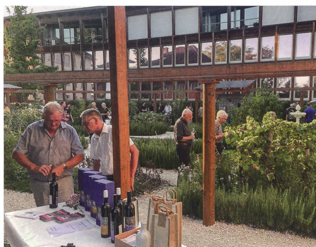
Abb. 9: Die Vindonissa-Winzer am Weinabend im römischen Garten vom 25. August 2022.