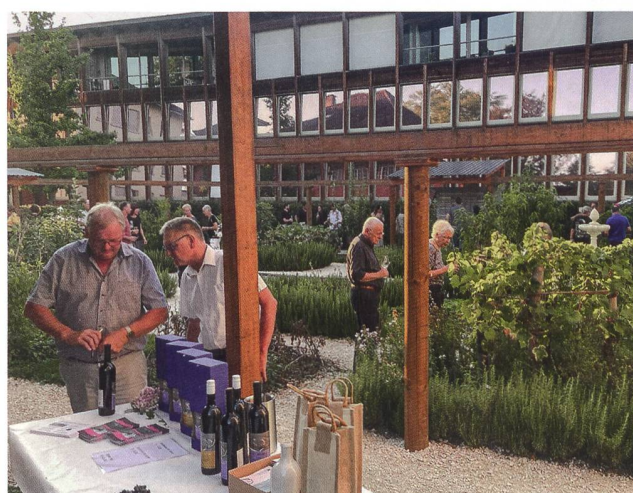
Abb. 9: Die Vindonissa-Winzer am Weinabend im römischen Garten vom 25. August 2022.