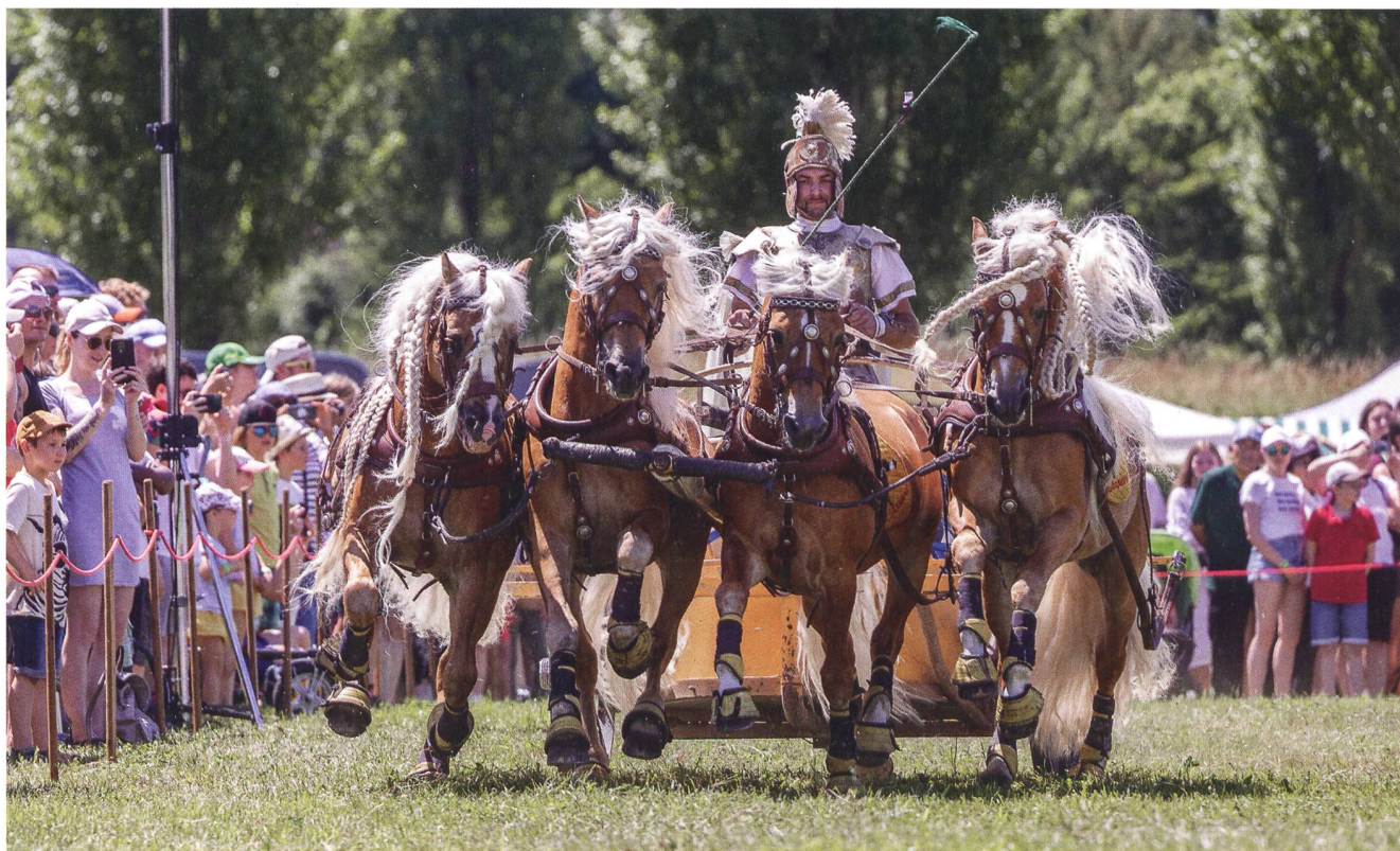
Abb. 4: Wagenrennen mit Vierspanner (quadriga) am Römertag Vindonissa.