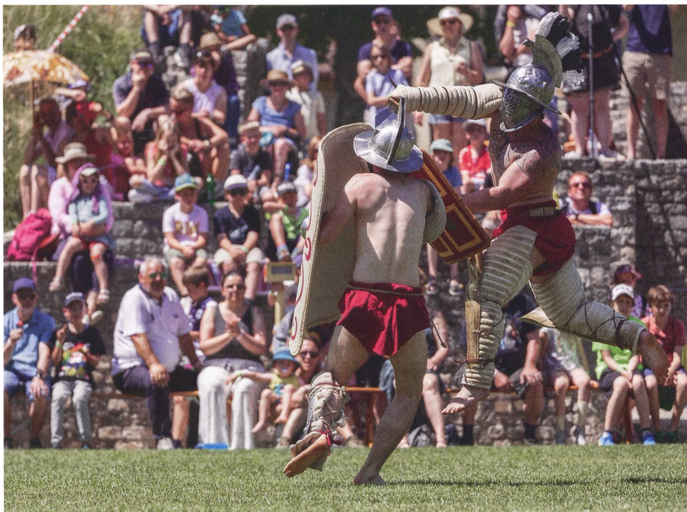
Abb. 5: Gladiatorenkämpfe am Römertag Vindonissa.