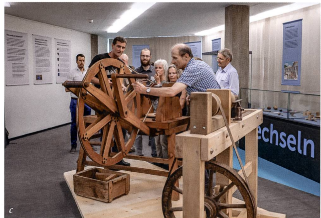
Abb. 5: Impressionen zur Ausstellung «QVO MODO FACTVM EST? – Römisches Handwerk im archäologischen Experiment» im Ausstellungssaal der Universitätsbibliothek Basel (20.06.–08.09.2019).