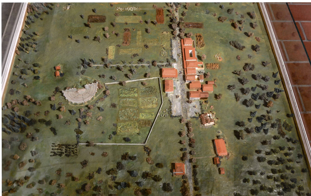
Abb. 10: Blick auf das bis 2017 im Museum Burghalde ausgestellte Modell des vicus von Lenzburg (Blick nach Osten). Neue Luftbilderaufnahmen und geophysikalische Prospektionen sprechen dafür, dass es sich bei der «Hofmauer» in der Bildmitte wahrscheinlich um eine Temenosmauer handelte, welche einen zum Theater gehörenden heiligen Bezirk (area sacra) begrenzte.

spätromischen Fundniederschlag zu rechnen ist. Dies ist – wie die in der Flur «Sur le Paplemont» zum Vorschein gekommenen Neufunde zeigen – offensichtlich nicht der Fall. Die wenigen antiken Funde bezeugen lediglich sporadische Begehungen während der Spätlatènezeit und der römischen Epoche, aber keinesfalls eine regelmässige und/oder intensive Nutzung. Anstehende Baumassnahmen im Bereich des Autobahnzubringers bzw. die Sanierung des «Unfallschwerpunkts