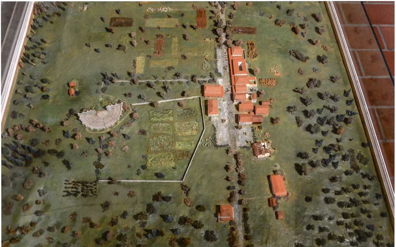
Abb. 10: Blick auf das bis 2017 im Museum Burghalde ausgestellte Modell des vicus von Lenzburg (Blick nach Osten). Neue Luftbilderaufnahmen und geophysikalische Prospektionen sprechen dafür, dass es sich bei der «Hofmauer» in der Bildmitte wahrscheinlich um eine Temenosmauer handelte, welche einen zum Theater gehörenden heiligen Bezirk (area sacra) begrenzte.

spätromischen Fundniederschlag zu rechnen ist. Dies ist – wie die in der Flur «Sur le Paplemont» zum Vorschein gekommenen Neufunde zeigen – offensichtlich nicht der Fall. Die wenigen antiken Funde bezeugen lediglich sporadische Begehungen während der Spätlatènezeit und der römischen Epoche, aber keinesfalls eine regelmässige und/oder intensive Nutzung. Anstehende Baumassnahmen im Bereich des Autobahnzubringers bzw. die Sanierung des «Unfallschwerpunkts