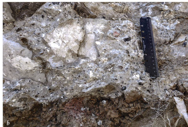
Abb. 6: Mumpf-Sanierung Kantonsstrasse (Mmp.019.2). David Wälchli und Daniel Huber (KAAG) bei der Reinigung des bei Bauarbeiten teilweise zerstörten Fundamentbereichs der spätantiken «Magazinstation» Mumpf-Burg (a). Detailaufnahme des nach wie vor «pickelhart» opus caementitium im Bereich der teilweise zerstörten Fundamentpartie (b). Gut zu erkennen sind die weissen Kalkspatzen (Klümpchen aus gelöschtem Kalk). Kalkspatzen wirken wie kleine Speicher, aus denen sich Calciumhydroxid lösen und an anderer Stelle kristallisieren kann. So können kleine Risse «verheilen» und der Mörtel erhält mehr Festigkeit.