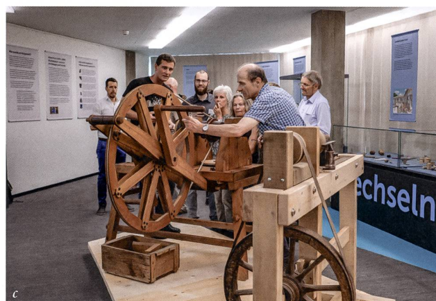
Abb. 5: Impressionen zur Ausstellung «QVO MODO FACTVM EST? – Römisches Handwerk im archäologischen Experiment» im Ausstellungssaal der Universitätsbibliothek Basel (20.06.–08.09.2019).