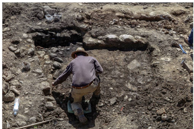
Abb. 7: Grabung Wallbach-Rheinstrasse (Wal.018.2). Grabungsleiter David Wälchli erläutert den Mitarbeitenden der KAAG und den Studierenden das weitere Vorgehen (a). Blick auf die Verfüllung des frühneuzeitlichen Kellers (b).