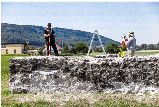
Abb. 4: Letzte Vermessungsarbeiten nach Abschluss der Sanierung des spätantiken Wachturms Schwaderloch-Oberes Bürkli im Sommer 2015.

Im Berichtsjahr 2015 stand die Baudokumentation des erst 1977 vollständig freigelegten und sanierten Wachturms Schwaderloch-Oberes Bürkli auf dem Programm. Die Arbeiten umfassten die Entfernung des Bewuchses, das Entfernen der modernen Auffüllung im Turminnen, die Reinigung des Mauerwerks sowie die Dokumentation der antiken Bausubstanz und der älteren Restaurierungsmassnahmen im Vorfeld der eigentlichen Sanierung des Mauerwerks (Abb. 4). Dabei zeigte sich, dass vor allem die Übergangszone zwischen den antiken und den 1977 restaurierten Teilen der Mauerschalen sowie die Mauerkrone in den vergangenen vierzig Jahren massiv unter den Witterungseinflüssen gelitten hatten. Weitere Arbeiten umfassten die Gestaltung der neuen, im Beisein des Gemeinderats eingeweihten Informationstafel, die Digitalisierung der 1977 angefertigten Dokumentation sowie – letztendlich erfolgreiche – Recherchen nach dem Verbleib des archäo(bio)logischen Fundmaterials. Letzteres soll – zusammen mit den aus den Bauuntersuchungen resultierenden, neuen Erkenntnissen sowie weiteren naturwissenschaftlichen Untersuchungen (u. a. Mörtelanalysen) – in absehbarer Zeit publiziert werden.