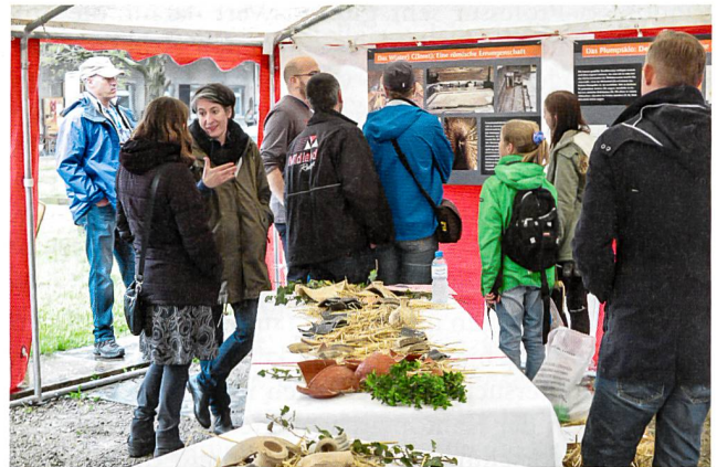
Abb. 3: Unser «Forschungsfenster» am Römertag 2015 «Stille Örtchen ausgeschöpft – Römische Latrinen unter der Lupe» stösst bei Gross und Klein auf Interesse.

Eine willkommene Gelegenheit für unsere Aktivitäten im Bereich «Bildung und Vermittlung» bilden jeweils auch die Römertage in Vindonissa bzw. die Römerfeste in Augusta Raurica . Im Berichtsjahr 2015 haben wir die Ergebnisse der bereits erwähnten Untersuchungen zum archäo(bio)logischen Fundmaterial aus den Latrinensedimenten in der Unterstadt von Augusta Raurica vorgestellt (Abb. 3) unter dem sinnigen Motto «Stille Örtchen ausgeschöpft: Römische Latrinen unter der Lupe».