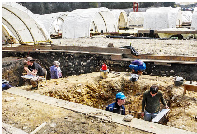
Abb. 1: Die Teilauswertung der grossflächigen Notgrabungen im Bereich der sog. Vision-Mitte (2006–2009) bildete Gegenstand der 2015 erfolgreich abgeschlossenen Dissertation von Hannes Flück.

Die Auswertung hatte zwei Hauptziele. Zum einen sollte die Siedlungsentwicklung desjenigen Teils der «Zivilsiedlung West» rekonstruiert werden, der nördlich der nach