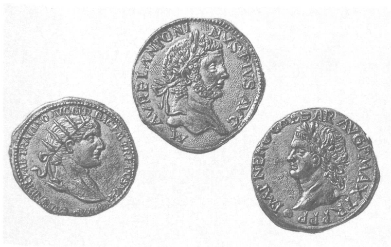
Münzen: Fr. 2.- bis 12.-