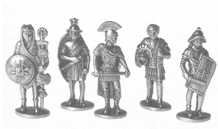
Zinnlegionäre: Fr. 1,50 bis 8.-

Buch mit vielen farbigen Illustrationen: Fr. 22.-