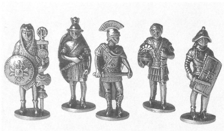
Zinnlegionäre: Fr. 1.50 bis 8.-