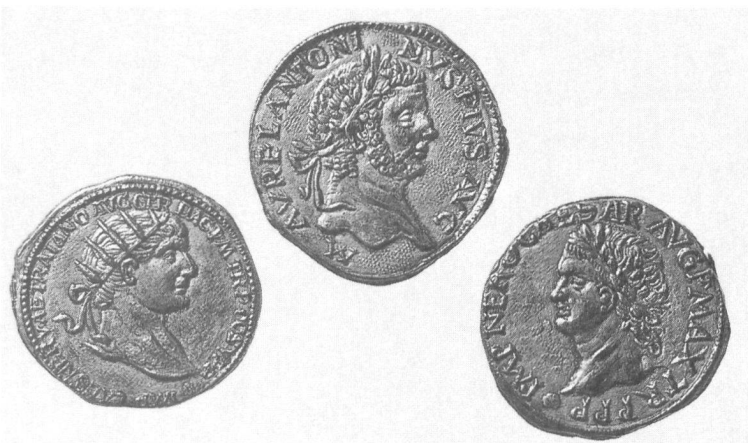
Münzen: Fr. 1.- bis 10.-