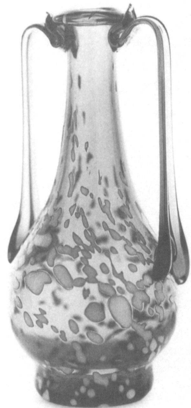
Amphoriskoi aus Glas: Fr. 30.–