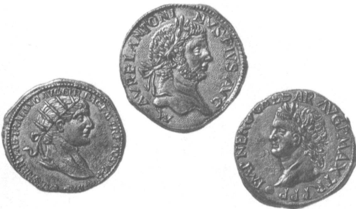
Münzen: Fr. 1.– bis 10.–