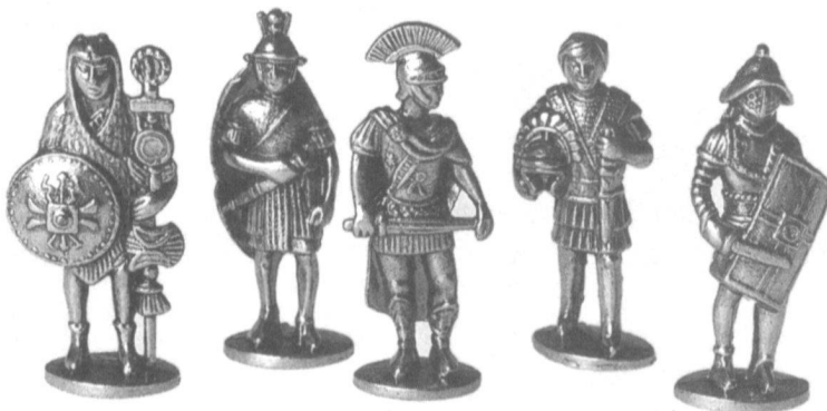
Zinnlegionäre: Fr. 1.50 bis 8.–