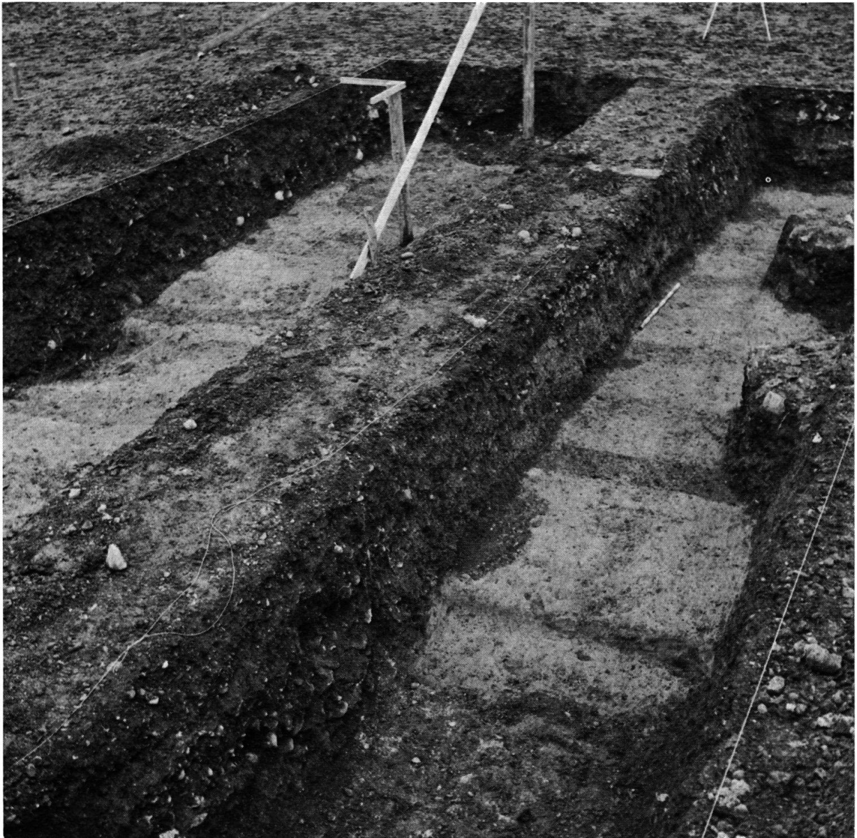
Abb. 2. Feld 6 und 7 auf Parzelle 1283 gegen Osten

dem von ihm ausgegrabenen Gebiet trafen wir auf eine solche Konzentration von Balkengräben, die, wenn sie damals die Oberfläche des gelben gewachsenen Lehms saubergeschabt hätten, nicht zu übersehen gewesen wären (Abb. 2). Man möchte meinen, daß die in geringen Abständen von höchstens 2 Metern nebeneinanderlaufenden Gräben, das unverkennbare Merkmal eines bestimmaren Holzbaugrundrisses darstellen würden. Es fehlen uns aber bis jetzt eindeutige, analoge Beispiele.