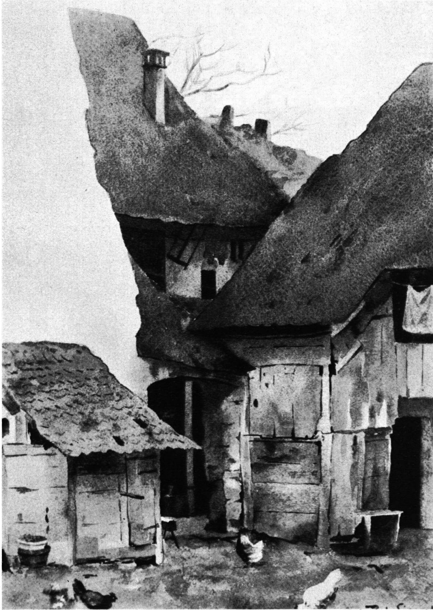
Abb. 29. Altenburg. Romantischer Winkel im Hof; nach einem Aquarell um 1905.