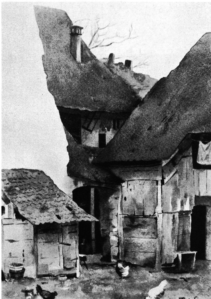
Abb. 29. Altenburg. Romantischer Winkel im Hof; nach einem Aquarell um 1905.