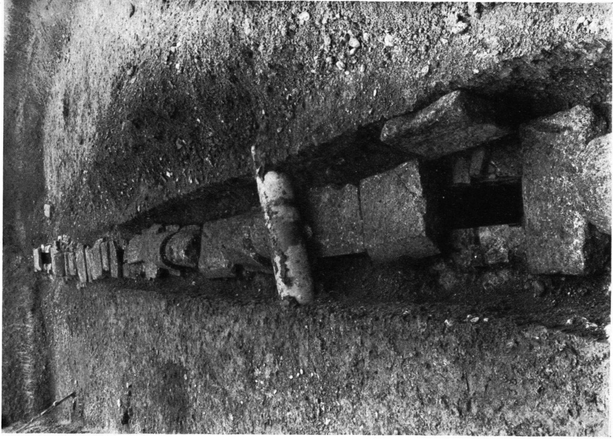
Wasserableitung im Aushub des Verwaltungsgebäudes Königsfelden (s. S. 3).