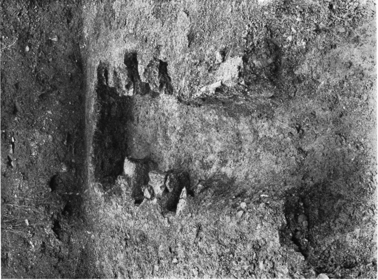
Ziegelbrennofen Verwaltungsgebäude Königsfelden (s. S. 3).