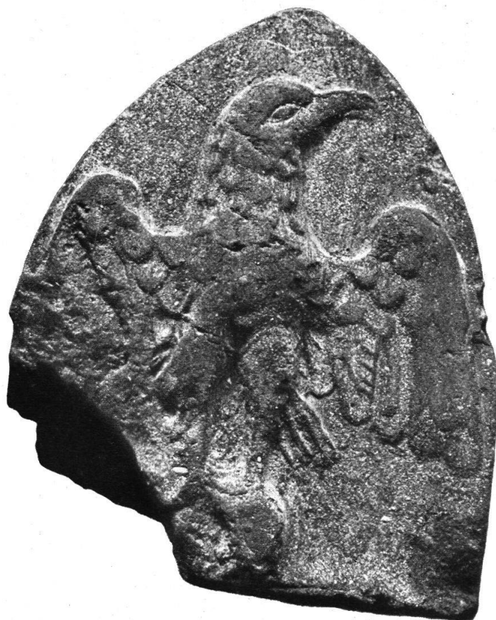
Stirnziegel , gefunden beim Westtore des Legionslagers. Der Adler, das Sinnbild der römischen Weltherrschaft, hält eine Kugel in den Krallen; siehe Baugeschichte Vindonissas, Tafel XXII, Ziffer 5.