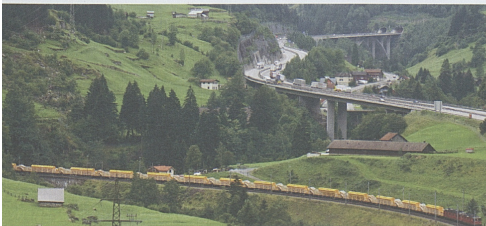
Auf dem Weg in den Norden: Der 400 m lange Betonzug wird von Biasca nach Erstfeld auf den Installationsplatz Rynächt überführt.

Bratschi: Tatsächlich werden grosse Strecken zurückgelegt. Wir versuchten aber von Anfang an, die Transportwege zu optimieren. Ein Beispiel dafür ist der 400 m lange Betonzug für den Bau der schotterlosen Fahrbahn.