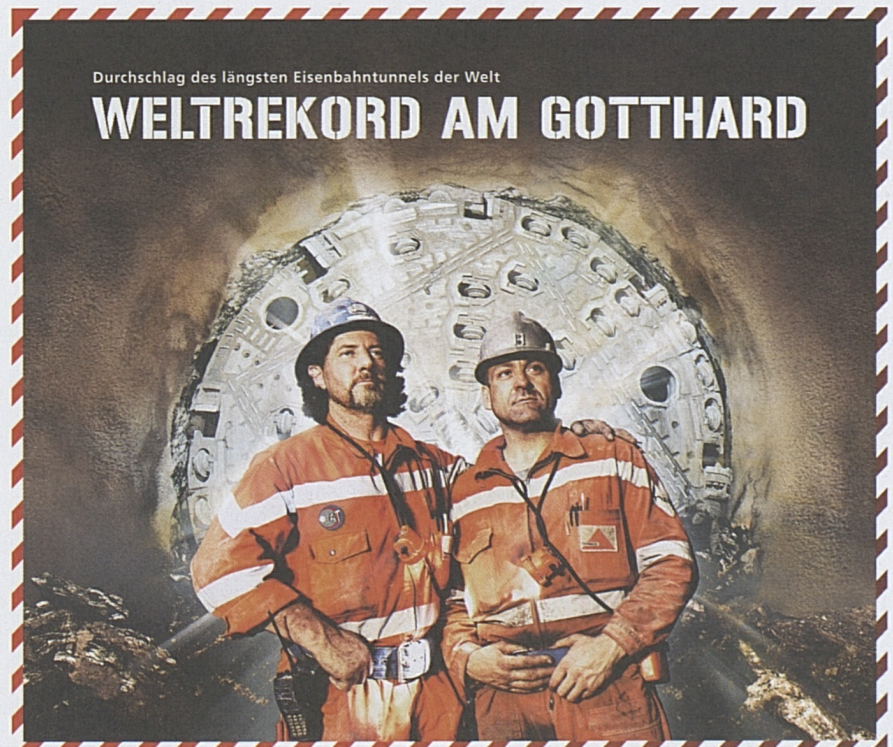
Die Helden vom Gotthard.

Rund 500 Projektbeteiligte verfolgten im feierlich beleuchteten Konzertsaal des KKL Luzern den Hauptdurchschlag auf Grossleinwand. Das Grollen und Brum-