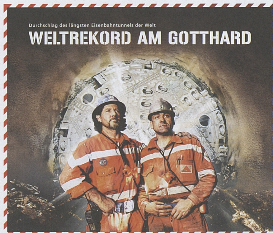
Die Helden vom Gotthard.

Rund 500 Projektbeteiligte verfolgten im feierlich beleuchteten Konzertsaal des KKL Luzern den Hauptdurchschlag auf Grossleinwand. Das Grollen und Brum-