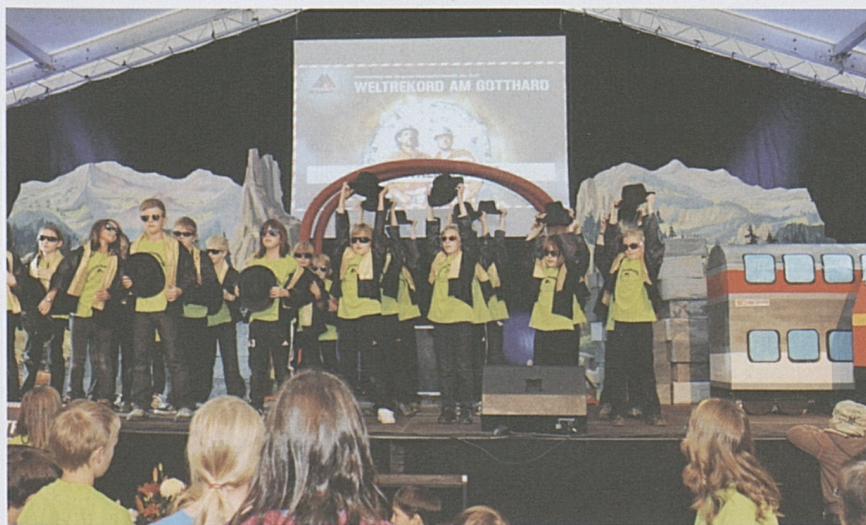
Die Primarschüler aus Tujetsch zeigen den Hauptdurchschlag am Fest für die Bevölkerung auf der Bühne.

men der Tunnelbohrmaschine war selbst im Konzertsaal spürbar. Das Komikerduo Lapsus moderierte den Festanlass. Musikalische Einlagen der Luzerner Band Spinning Wheel, bildliche Impressionen zur Baugeschichte und Anekdoten ehemaliger Projektbeteiligter bereicherten das Programm. Die Patrouille Suisse erwies den Gästen mit besonders tiefen Überflügen über das Luzerner Seebecken die Ehre. Natürlich fehlte auch die Formation Tunnel nicht. Franz Hohler begeisterte mit einer Lesung, in der er sich an seine Begegnung mit der Tunnelbrust erinnerte. Beim Apéro und beim anschließenden «Tunneldinner» stiessen die Gäste mit einem Glas Tessiner Merlot auf den geglückten Meilenstein an.