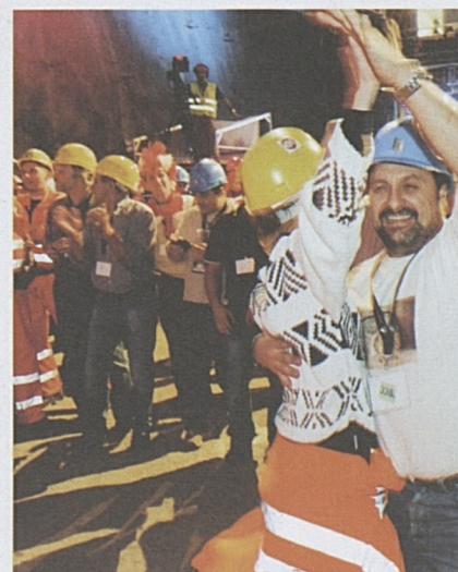
Freudentanz der Mineure in Faido.