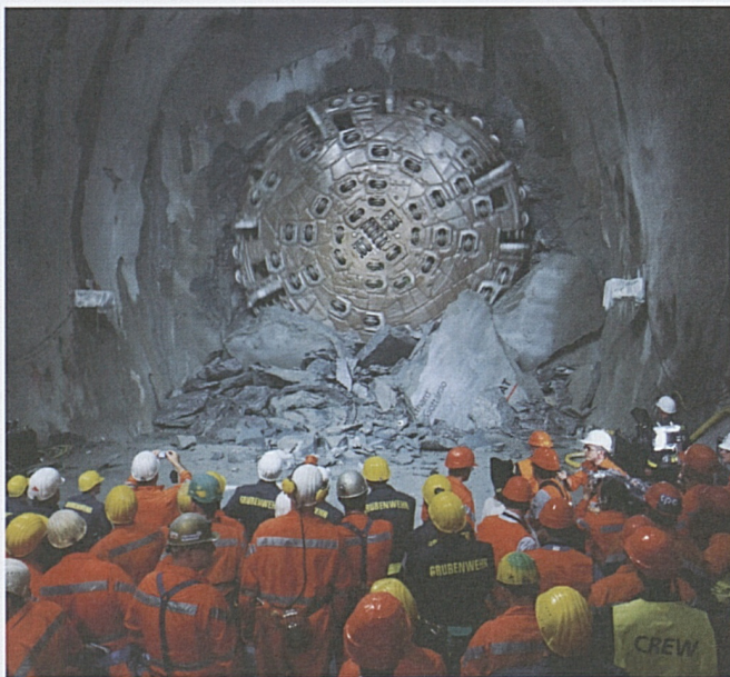
Kurz nach dem Durchbruch: Der glänzende Bohrkopf stösst die letzten Felsblöcke aus dem Weg.