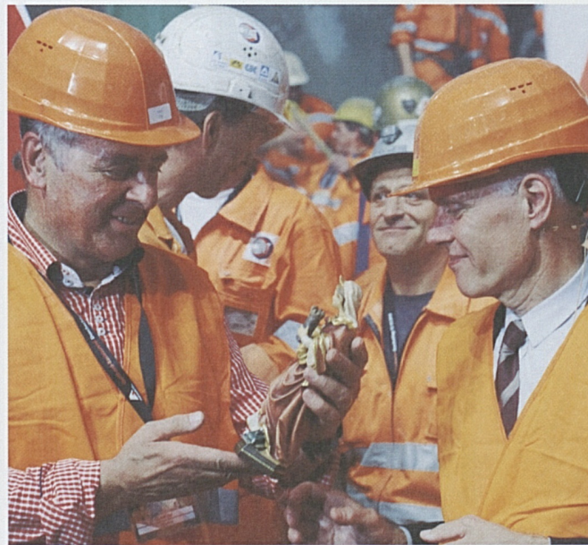
Alt Bundesrat Adolf Ogi und Bundesrat Moritz Leuenberger mit der heiligen Barbara.