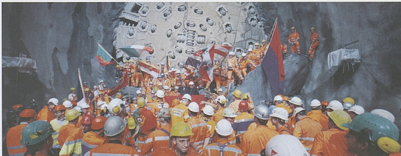
Flaggen aus allen europäischen Ländern: Mineure der ARGE TRANSCO begrüßen nach dem Durchschlag ihre Kollegen der ARGE TAT.