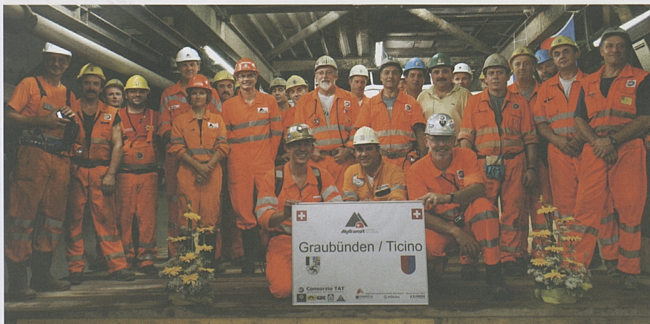
Zufriedene Vortriebscrew auf der Tunnelbohrmaschine: Die Kantonsgrenze Graubünden-Tessin ist erreicht.