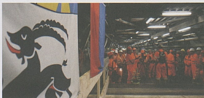
Der Meilenstein wird gefeiert.