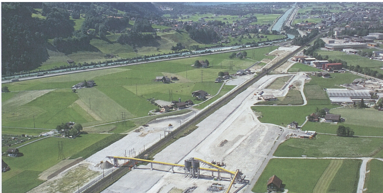
Blick Richtung Norden: Der Teilabschnitt Altdorf/Rynächt mit der offenen Strecke im nördlichen Teil.