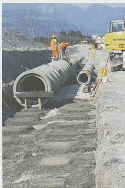
Verlegen von Trasse- und Bergwasserleitungen.

Im Frühling 2009 werden die verschiedenen Hauptarbeiten (Los 044) beginnen. Es sind dies: