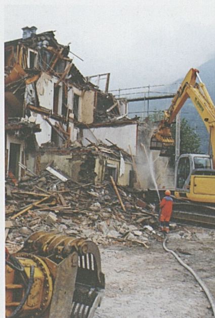
Abbrucharbeiten am Restaurant Walter Fürst.