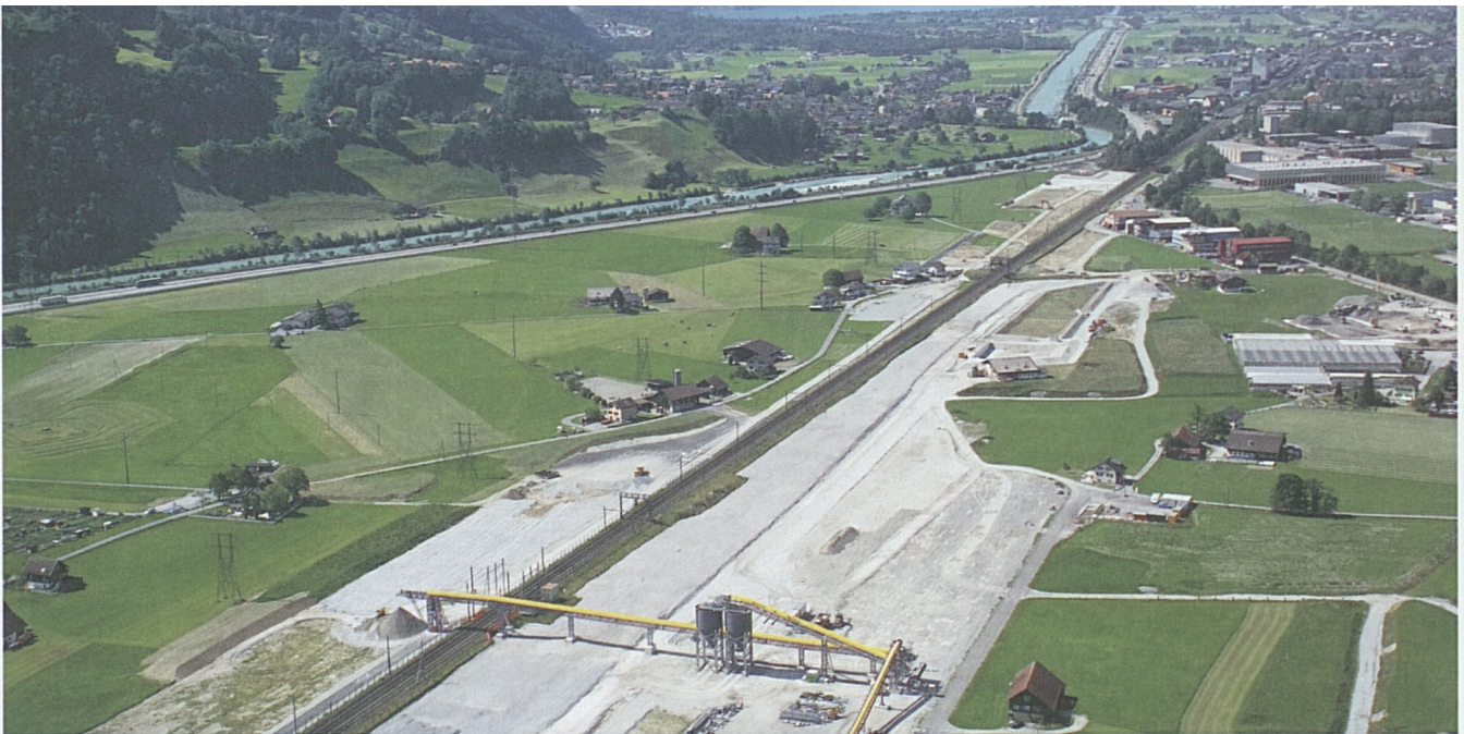
Blick Richtung Norden: Der Teilabschnitt Altdorf/Rynächt mit der offenen Strecke im nördlichen Teil.