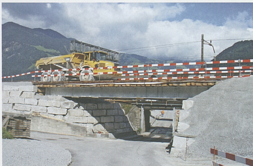
Bestehende Unterführung Riedstrasse: Hilfsbrücke für Mulden-Dumper.