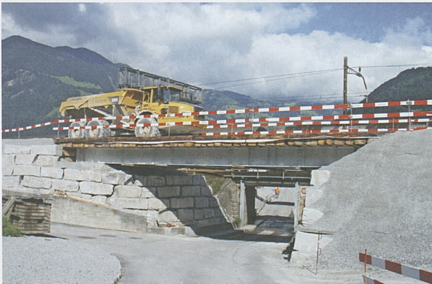
Bestehende Unterführung Riedstrasse: Hilfsbrücke für Mulden-Dumper.

Im Frühling 2009 werden die verschiedenen Hauptarbeiten (Los 044) beginnen. Es sind dies: